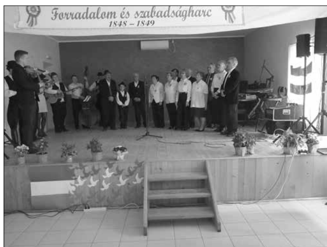
A maradéki tamburazenekar és a Tarcál vegyes kórus