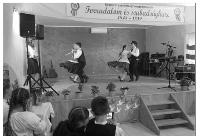
A Sarkantyúsok fergeteges tánca