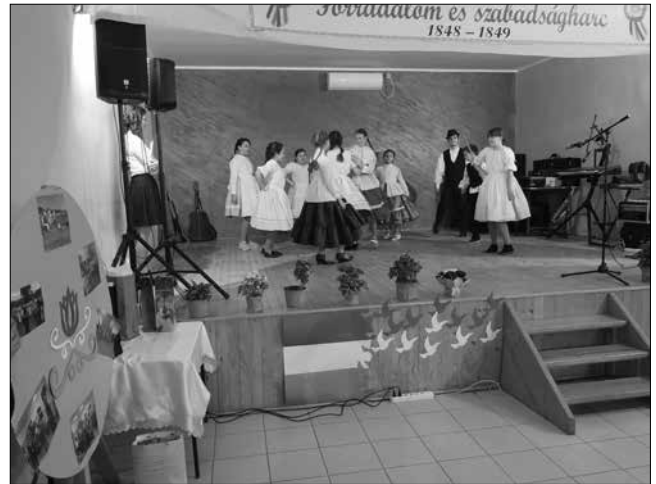
A satrincai néptáncosok bemutatkozása

ten tovább is.” S volt, aki együtt dúdolta, szintén a szépkorúak közül, a katonadalokat a satrincai Petőfi Sándor ME asszonykórusával.