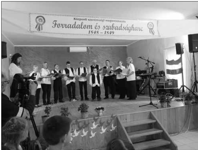
A szávaszentdemeteri vegyes kórus