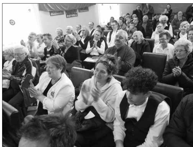
Vastaps a fellépőknek, a díjazottaknak