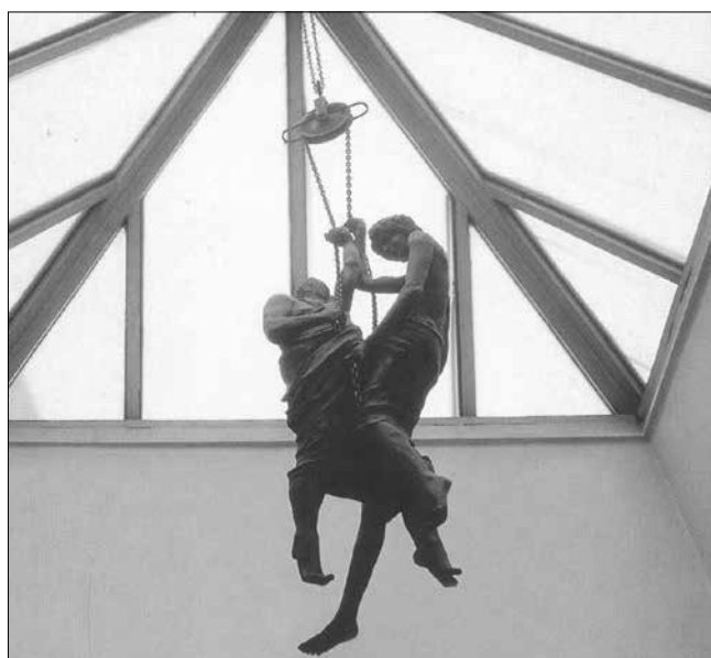
Arkhimédész és az ifjú

(In: Melocco Miklós. Kráter Műhely Egyesület, Pomáz, 2000)