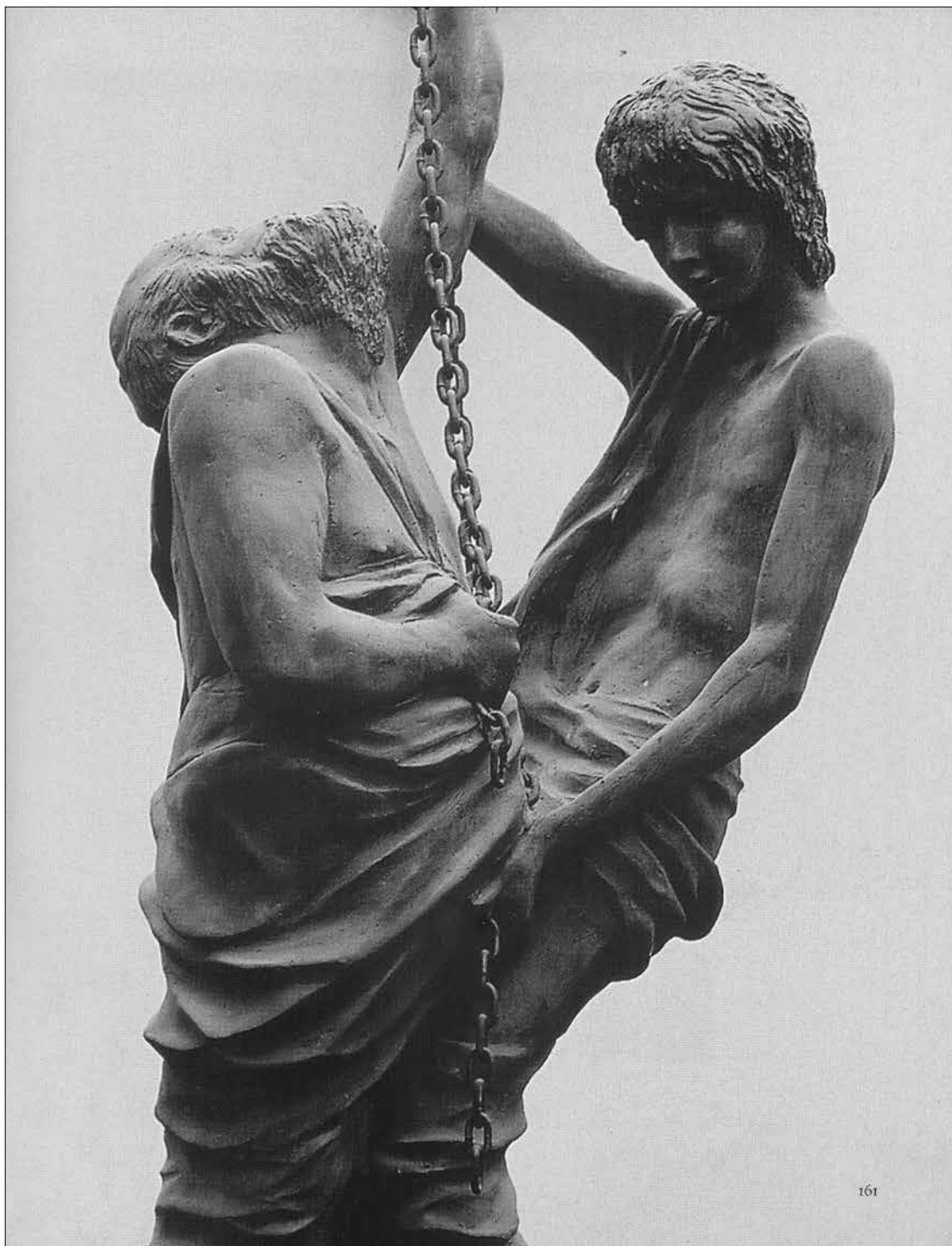
Arhimédész és az ifjú – részlet (Budapest, az Építőipari Szakközépiskola aulája)