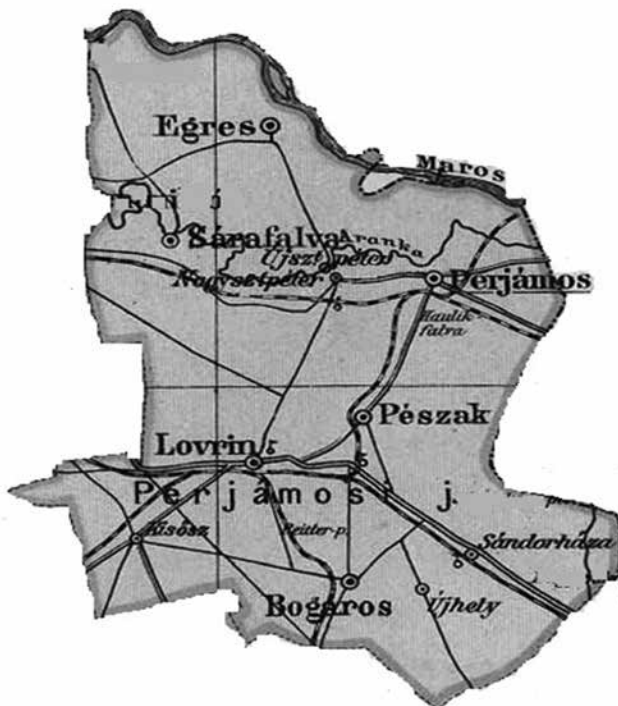
A Perjámosi járás térképe