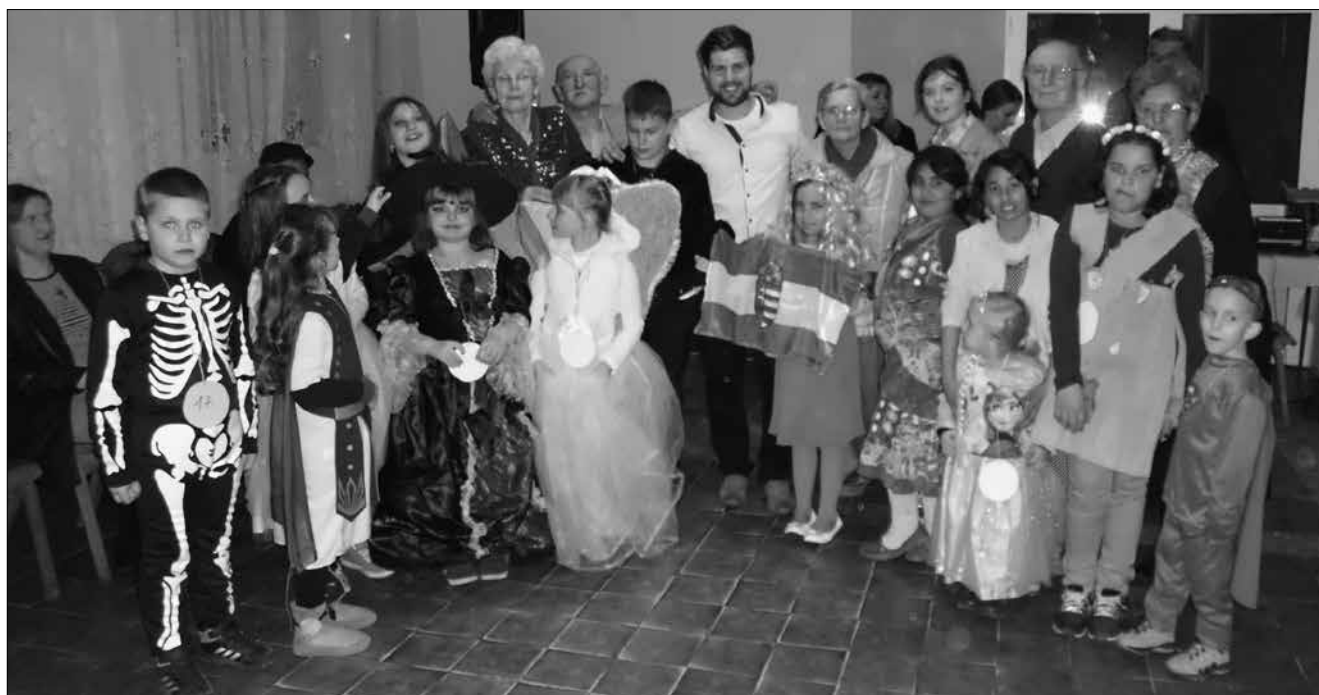
A mesék hőseit megelevenítő tündérekkel, manókkal, csodalényekkel a farsangfarki mulatságon 2019-ben

minden nehézségen. S amíg lesz rá igény, továbbra is elhangzik itt is Isten ígéje magyarul.”