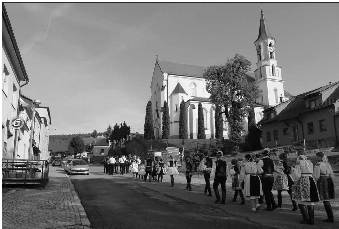
A Kistelepülések Európai Piknikje résztvevőinek felvonulása Březovában

gyerekekkel, a fiatalokkal, néptáncot is tanított nekik. Ismerte őket, így könnyebb volt felidézni az előző tanévben tanultakat.