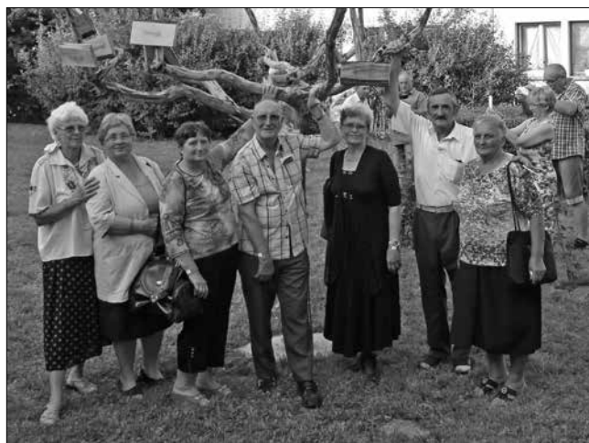
Alsónyéken, a Nyék-fa ágai alatt...

A másik jelentős esemény (2016.) július 24-én volt Nyékincén. Valamennyien osztozhattunk,