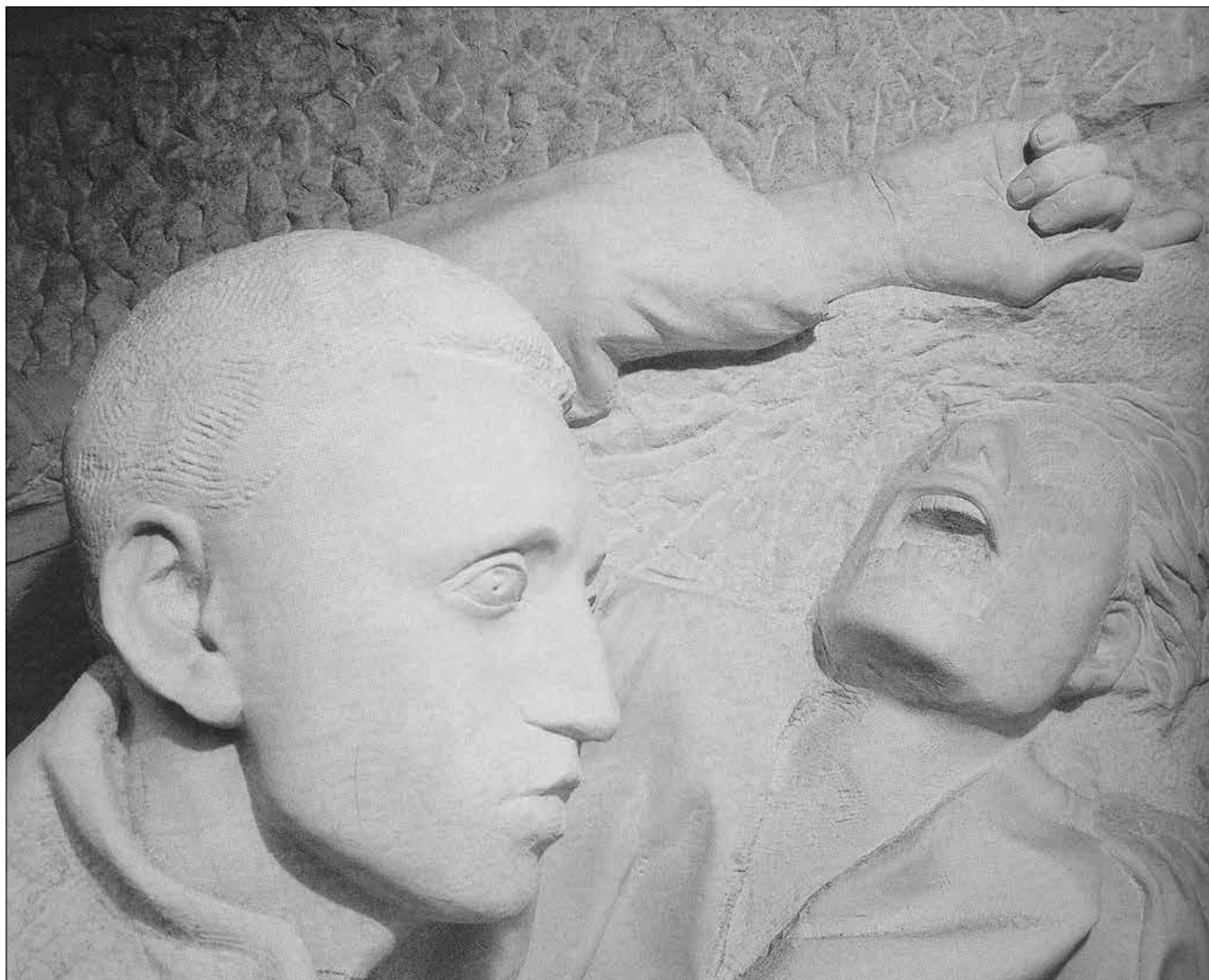
'56-os emlékmű – részlet (Szeged)

A zászló hirdeti, hogy a magyar nép harca a szabadságért '56-ban sem volt hiábavaló, letiporták, mégsem győzték le, az a szabadságharc vezetett el a rendszerváltozáshoz, és a Góliáttal szembe forduló Dávid indította el a kommunista diktatúrák felbomlását, pusztulását Közép-Európában. Sajnos a kommunista eszme mostanában, főképpen Nyugaton kezd meggyökerezni, baloldali, zöld és liberális köntösbe bújtatva.