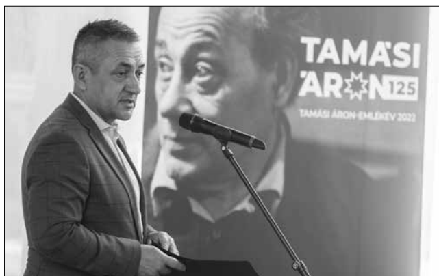
Potápi Árpád János államtitkár