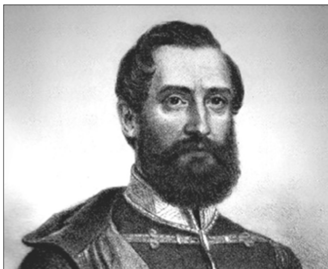
Szkárosi Lázár Vilmos honvéd ezredes, aradi vértanú

Forrás: Szamossy Elek (1826–1888): Lázár Vilmos honvéd ezredes, aradi vértanú. Litográfia, 1879. Az aradi vértanúk családjai, 2018. október 6. Gondola.hu – online újság: https://gondola.hu/cikkek/111123-Az_aradi_vertanuk_csaladjai.html (Letöltés ideje: 2021. június 24.)