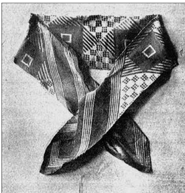
A selyemkendő, amellyel Lázár Vilmos szemét bekötötték a főbelövés előtt