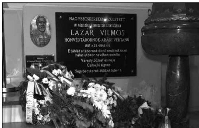
Lázár Vilmos aradi vértanú emléktáblája Nagybecskerekén, a Nepomuki Szent János-székesegyházban

Forrás: Szamossy Elek (1826–1888): Lázár Vilmos honvéd ezredes, aradi vértanú. Litográfia, 1879. Az aradi vértanúk családjai, 2018. október 6. Gondola.hu – online újság: https://gondola.hu/cikkek/111123-Az_aradi_vertanuk_csaladjai.html (Letöltés ideje: 2021. június 24.)