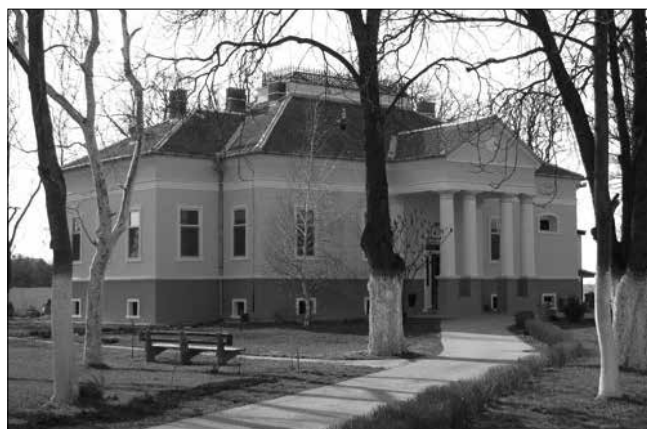
A másik, egykori Dániel-féle kastély Óléczen, ma pszichiátriai intézet