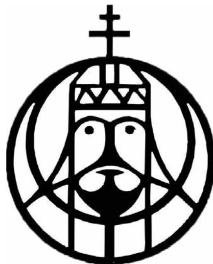
Az Aracs első számának fedlapja és a Szent Istvánt ábrázoló logó