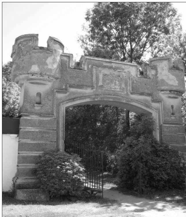
Az egykori bánlaki Karátsonyi-kastély megragadó hátsó díszkapuja