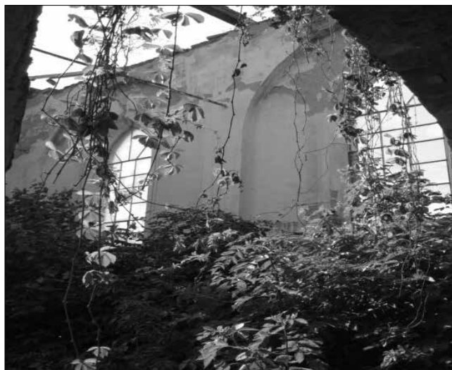
Karátsonyifalva egykori római katolikus templomának főhajója