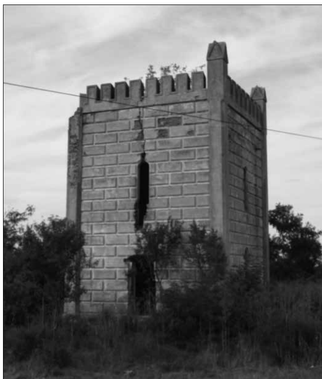
Mementó – az egykori bánlaki Karátsonyi-uradalom határán álló őrház