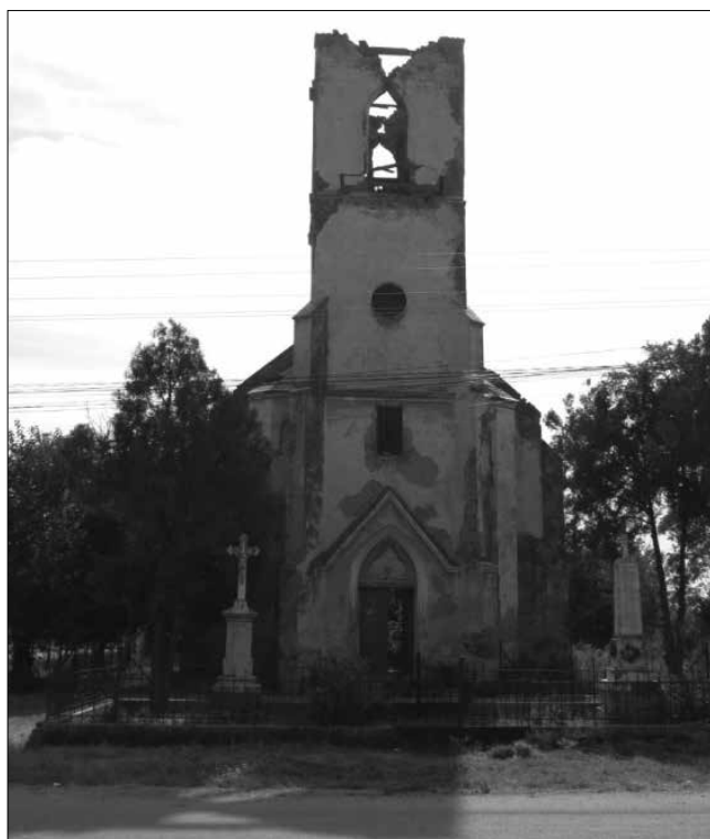
Karátsonyifalva egykori római katolikus temploma

Karátsonyiliget (Soca), akárcsak a szomszédos települések zöme a történelmi múltban – a 19. század hajnalától – a Karátsonyi család települése volt. Korábban a helység neve Szoka volt, és jobbára pravoszláv vallású szerbek által lakott falunak számított. A román kommunizmus bukását (1989) követő első román népszámlálás (1992) egyedülálló nemzetiségváltási folyamatot mutatott ki. Az addig többségi népcsoport, a szerb kisebbségbe került, de nem az ortodox hitű románsággal, hanem az ugyancsak ortodox tanítást követő ukránokkal szemben. A nemzetiségváltási folyamat okainak vizsgálata mindenképp egy kutatást igényelne. Röviden csak annyit jegyzünk meg, hogy a 2011. évi román