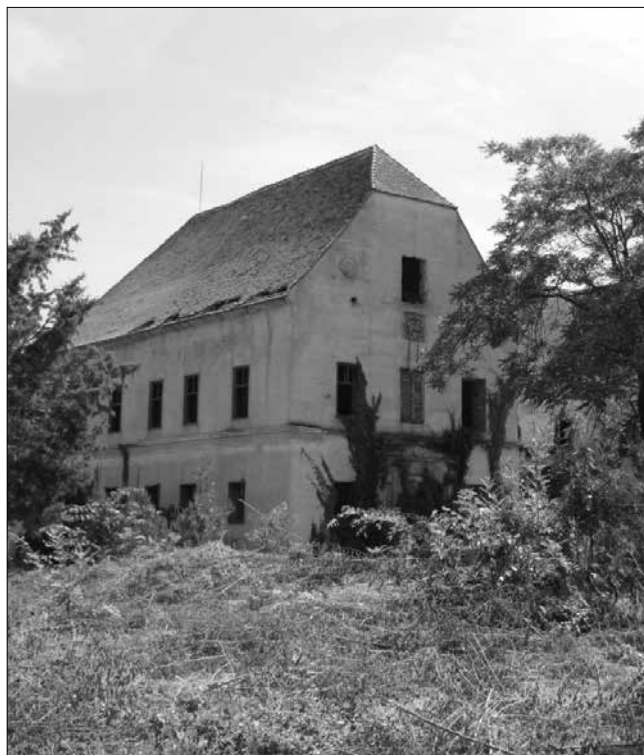
Az egykor pompás Karátsonyi-kastély és az elvadult kastélypark