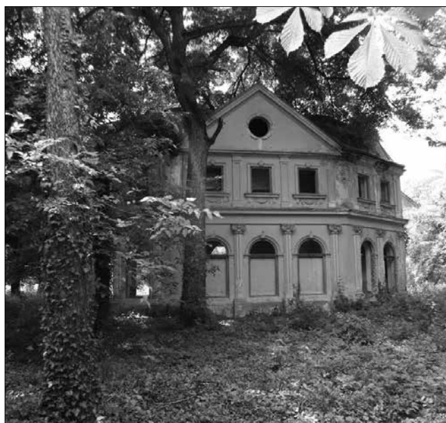
Az egykori kastélypark jobb időket is megélt kerti pavilonja

Az egykori járási székhelyen – 1910-ben – még a népesség 15,1% volt magyar anyanyelvű. Száz évvel később, a 2011. évi román népszámlálás adatai szerint a magyarság soraiból alig maradt hírmondó is. Mindössze hat fő (0,4%) vallotta magát magyar nemzetiségű személynek a jobbára románok és romák által lakott faluban. 5