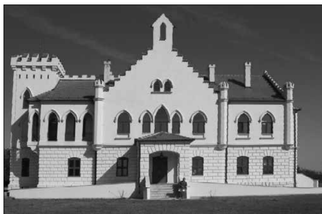
A felújított, egykori Botka-féle kastély Ólécz határában