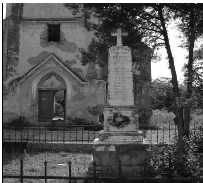
Az első világháborús emlékmű