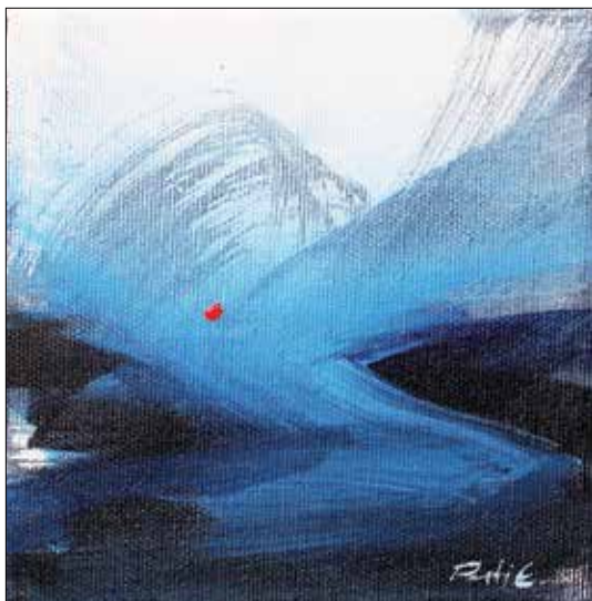
Hallgass meg! I.