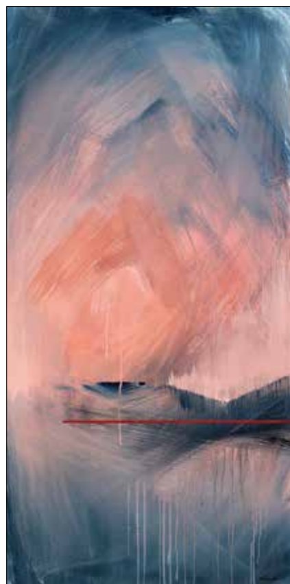
A délután elolvad