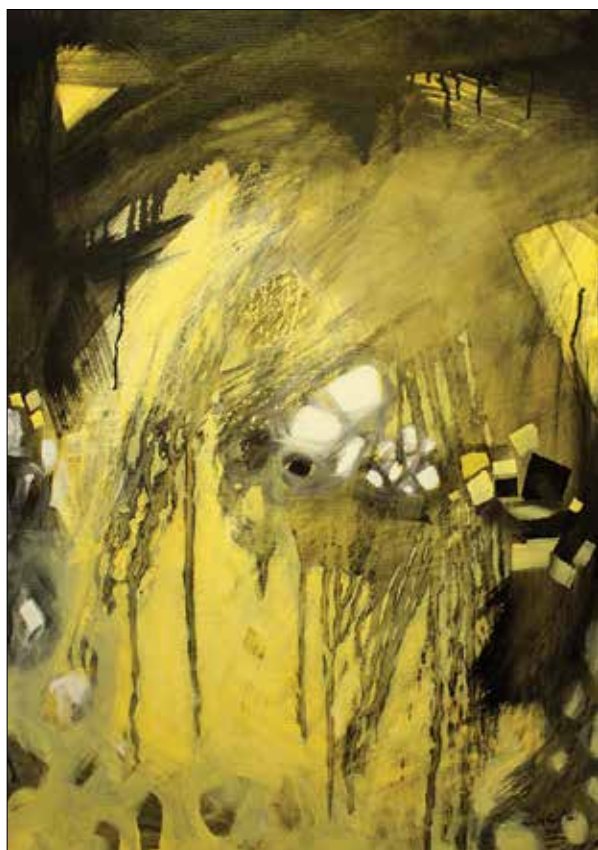
Felhőkben a por I.