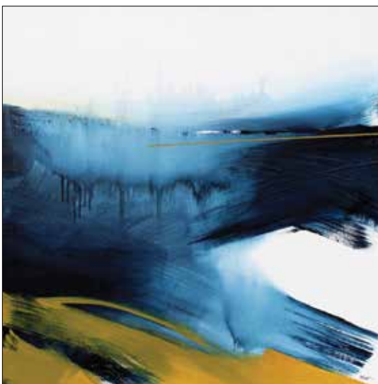
Nyughatatlan nyugalom II.