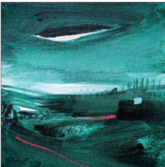
Will I Be Here after All My Thoughts Are Done? I.