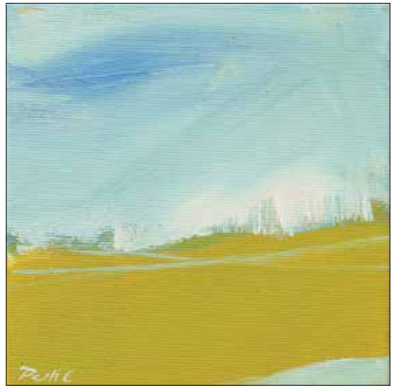
Hallgass meg! VIII.