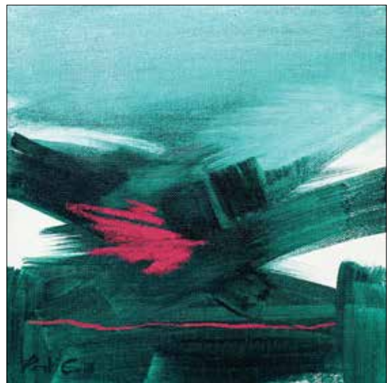
Will I Be Here after All My Thoughts Are Done? II.