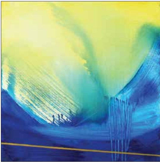
Hideg március II.