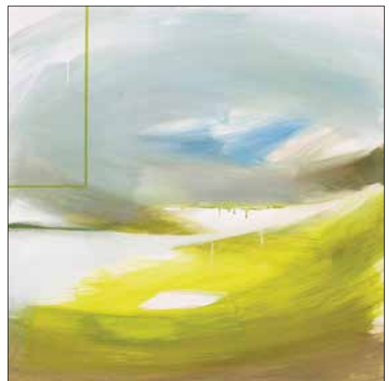
Jobb lesz holnap I.