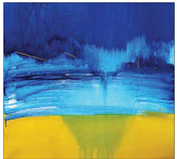
Hideg március I.