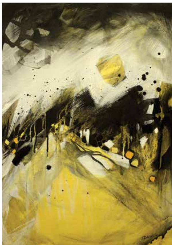
Felhőkben a por II.