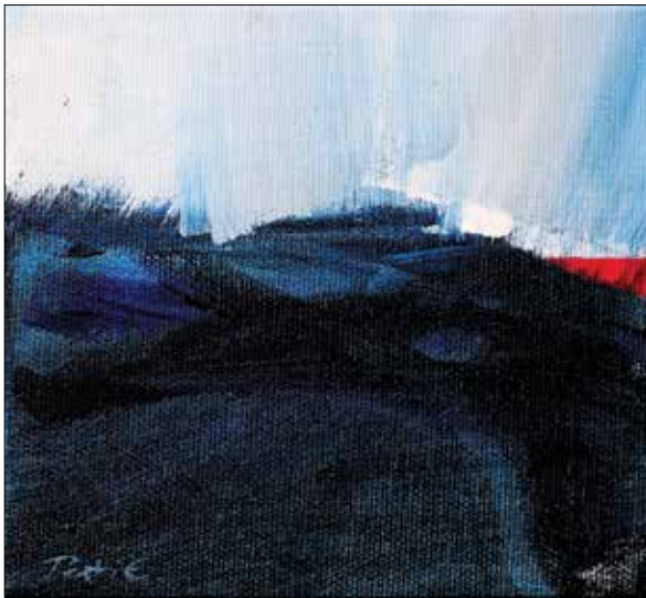
Hallgass meg! II.