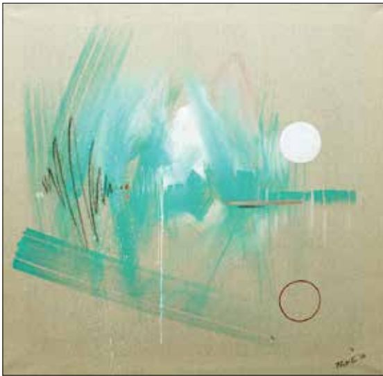
Csak egy pillanatra