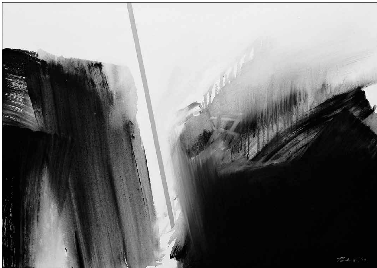
Két part között I. – Hommage à Benes József