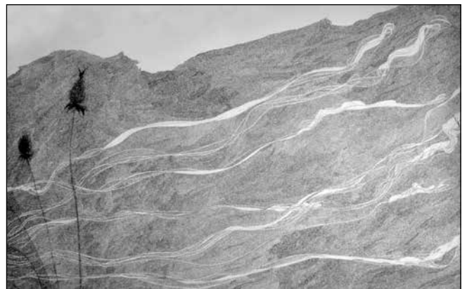
Ökörnyál, Dobó Tihamér rajza

De e táj szelleme, genius locija, jóval többet kínál, mint a megzavarodott lélek öntisztítását, gyógyítását. A mozdíthatatlanság geniusa egy régi-új kultúra alapzatát őrzi a mélyben és