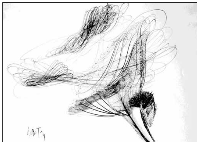
Kóró I., Dobó Tihamér rajza

Ebben lennék én, kóróember leginkább ott-hon, ebben és ettől látok akképp, ahogy, és ettől