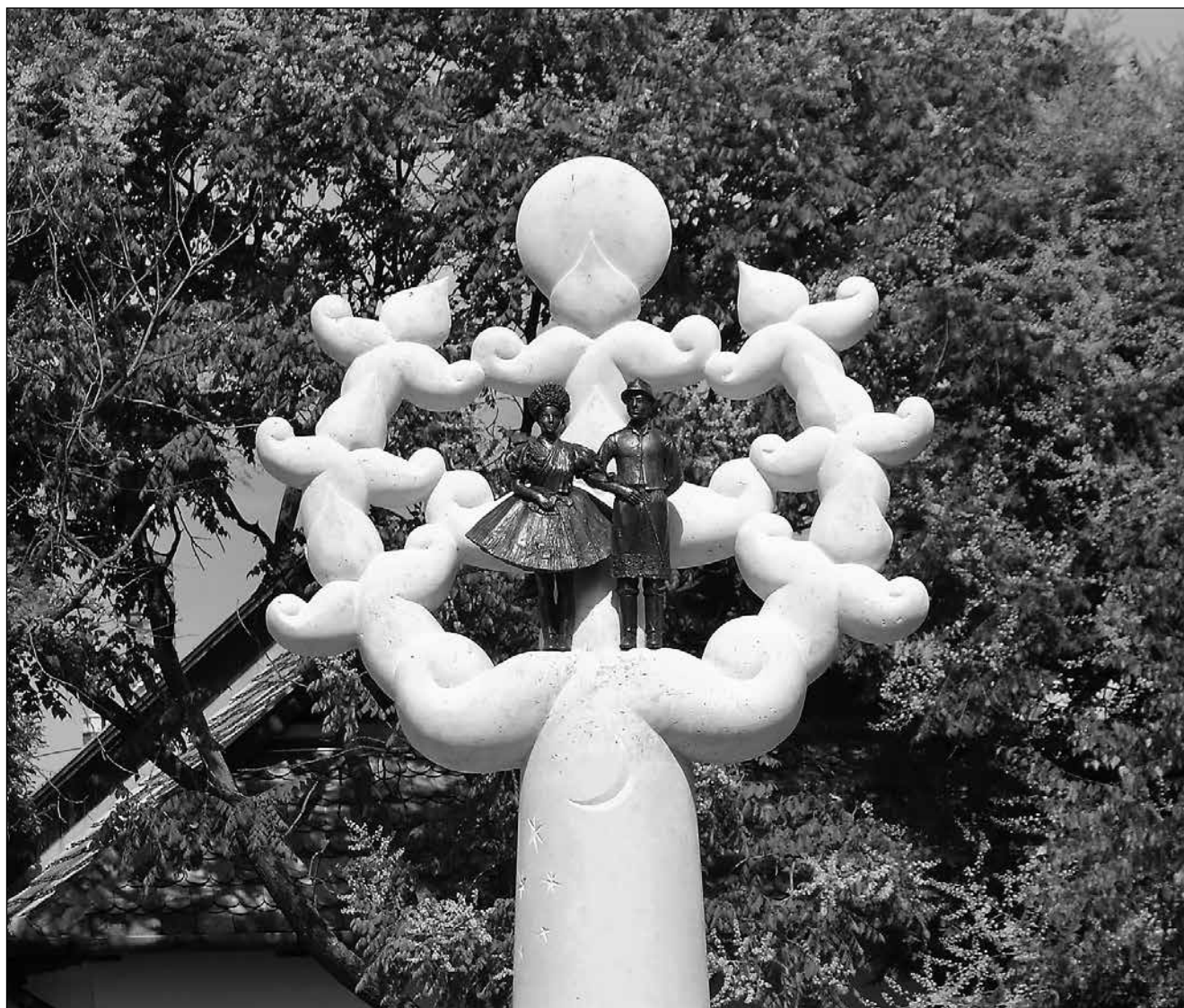
Életfa – részlet