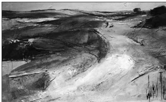
Járás I., Dobó Tihamér festménye

A suttyó koromban szinte észrevétlen megragadott Járás-élmény azóta is fogva tart. A szülő-