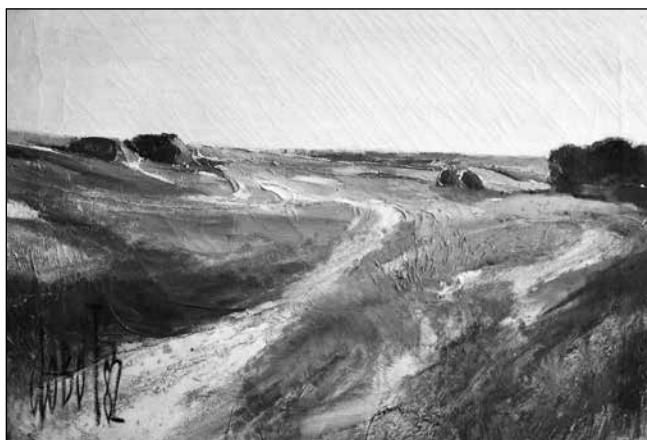
Járás III., Dobó Tihamér festménye

Vagy a nyár hangjai! A csönd nagy vásznára írt milliónyi apró zizegés, csipogás, cirpelés kottái. A csippenésre szélzúgás válaszol, a károgásra trilla, a vijjogásra susogás... micsoda szimfónia egy légy közeledő-távolodó röptének bonyodalma! Ha jól odafigyelünk, és mindent, mint folyamatos muzsikát hallgatunk, még az ember gépeinek oda nem illő bűgását, zúgását is minden alkalommal követi egy helyrebillentő hang vagy hangsor. Hangszínekkel, dallamokkal, ritmusokkal is gyógyít a természet!