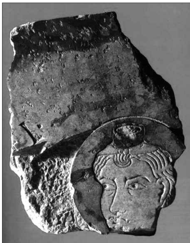
Dániel próféta feje – Porta Speciosa, Esztergom

– A Habsburg Birodalom lényege volt a Magyar Királyság uralása. Földrajzilag, erőforrásaiban Ausztria fejlődése elképzelhetetlen lett volna a