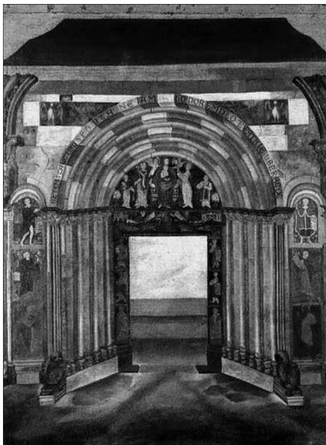
Az esztergomi Szent Adalbert székesegyház „gyönyörűséges kapuja”, a Porta Speciosa. Ismeretlen festő olajképe, 1781 előtt

Arról sem beszélünk túl gyakran, hogy 1301-ben az Árpád-ház nem halt ki, csak férfiágon. Rengeteg leányági örökös volt még akkor, de azt nem tanítjuk! Érdekes módon arról is hallgatunk, hogy III. Károly – Mária Terézia apja – halálával kihalt a Habsburg-ház! Jóllehet, arról meg mindenki tud, hogy a magyar nemesek a pozsonyi országgyűlésen megszavazták, elfogadták a leányát királynénak: „ Életünket és vérünket Mária Teréziáért... ”