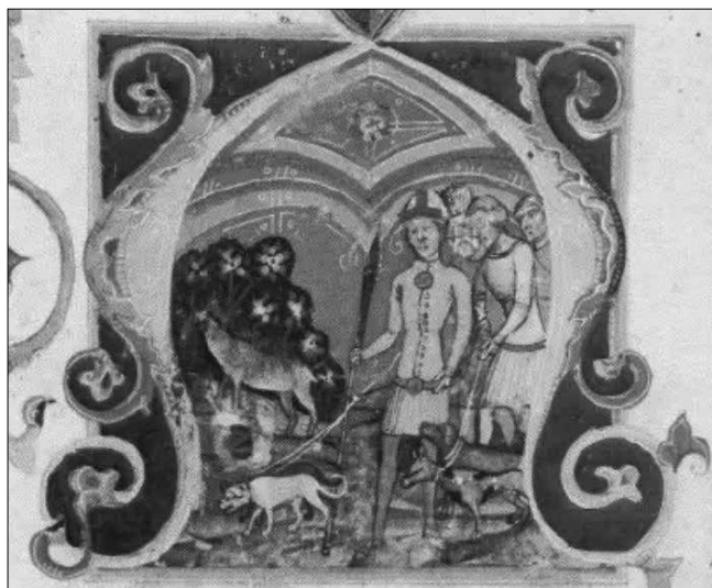
Hunor és Magor ábrázolása a Képes Krónika lapjain

Addig a középkorban minden krónikákon, évkönyveken alapult. A krónikások nem voltak tanulatlan emberek, nem a mesékre építettek. A szkíta ősokeket, hunokat, avarokat elődjüknek tartották, ami nem lehetett alaptalan.