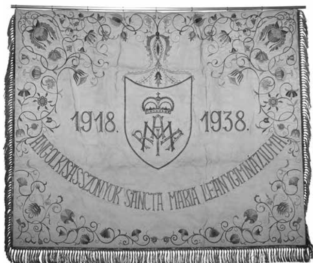
A budapesti Angolkisasszonyok Santa Maria Leánygimnáziuma zászlója, 1938 (ma: Ward Mária Általános Iskola és Gimnázium)

Vezess hát zászlónk, égi jel Lobogj szeplőtelen: követve téged, miénk a végső győzelem!