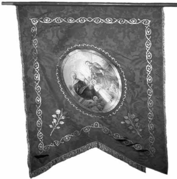
Az óbudai Szent Péter és Pál templom fecskefarkú selyemzászlója, 19. század 2. fele (hátlap)