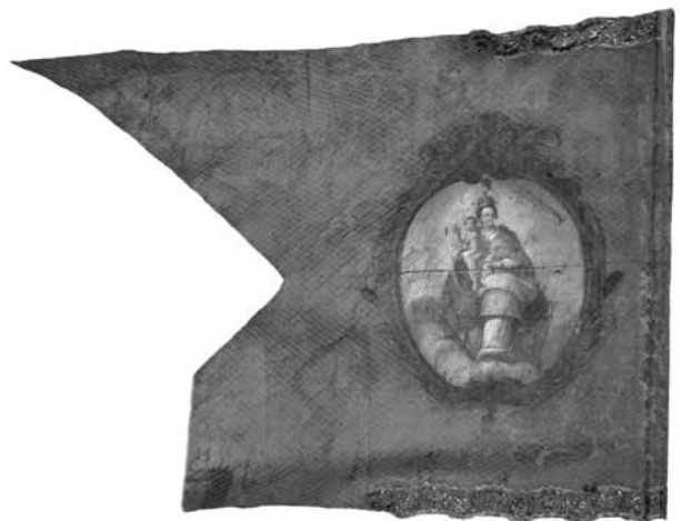
Esztergom vármegye lovassági zászlója, 1740–1760. Hátlap: Patrona Hungariae, Hadtörténeti Múzeum, Budapest, Zászlógyűjtemény 0076/zl.

Esztergom vármegye 1740–1780 között vörös selyemből készült, fecskefarkú lovassági zászlójának előlapján az ovális keretbe foglalt olajfestmény Szent István király országfelajánlását ábrázolja. A király hermelinszegélyes aranypalástban, az oltár előtt térdelve ajánlja az országot jelentő Szent Koronát az Istengyermekek tartó és az oltáron, felhők fölött megjelenő Magyarok Nagyasszonyának. A hátlapon az ugyancsak