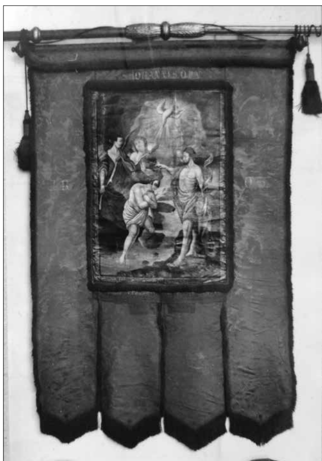
A cserzővargacéh zászlója, 1803. A Budapesti Történeti Múzeum Kiscelli Múzeuma

gek jelvényei mellett az illető céh védőszentje is gyakran megjelenik. Külön alfejezet foglalkozik a céhek védőszentjeivel, oltáraikkal és a céh patronusának a tiszteletére rendezett ünnepélyes szentmisékkal.