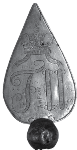
Vas vármegye nemesi felkelőinek zászlója, elő-, hátlap és zászlócsúcs, 1792–1806, Hadtörténeti Múzeum, Budapest, Zászlógyűjtemény 00114/zl.

A 1848-as dicső, remekművű zászlókat külön fejezet tárgyalja. Ezután a 20. század első felének katonai zászlóit ismerhetjük meg. A kötetet a trianoni békediktátum elleni tiltakozásul 1928-tól felállított Országzászlók bemutatása zárja.