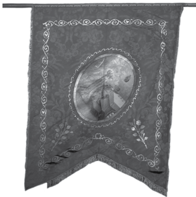
Az óbudai Szent Péter és Pál templom fecskefarkú selyemzászlója, 19. század 2. fele (előlap)

Ezek közül emelem ki az óbudai Szent Péter és Pál templom vörös színű, fecskefarkú, 1900 körül készült selyemzászlóját. A 108 × 115 cm nagyságú zászló előlapját a Szent István király országfelajánlását ábrázoló olaj-vászon kép ékesíti. A király vörös palástban, térdelve, párnán tartja a Szent Koronát és a többi koronázási