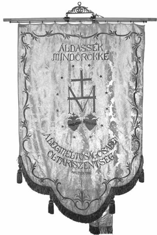
A Szentendrei úti Kövi Mária-templom Oltár-egyesületének selyemzászlója, 1938 (hátlap)

ékszer, és helyezi a Magyarok Nagyasszonya oltárára. Az oltáron ott van a feszület, a gyertyatartók mellett pedig a misekönyv és a magyar kiscímer is. A hátlapon a hazatérő Szent Család olaj-vászon képe látható ovális keretben.