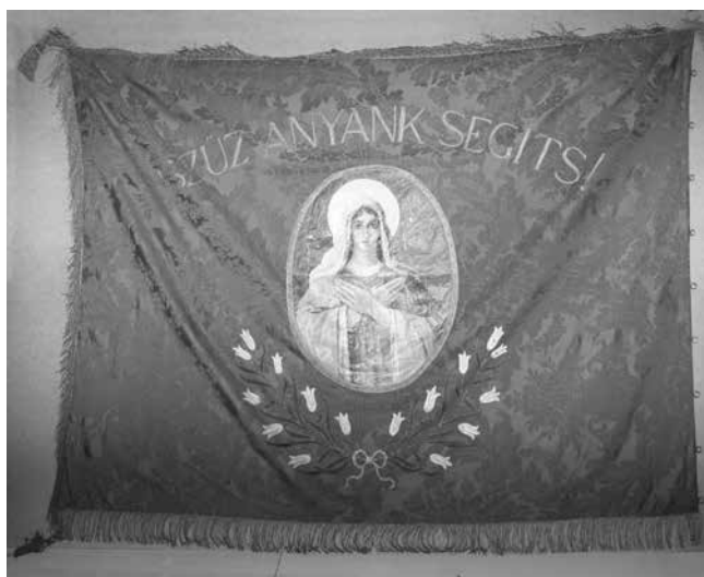
A Boldogi Önkéntes Tűzoltó Testület zászlója, 1924. Katasztrófavédelem Központi Múzeuma, Zászlógyűjtemény AT 74.2.1.

Budapestre érkezésekor, az 1885. 1915. és az 1930, 1931. évi Szent Jobb-körmeneteken, a leírásokat fényképek színesítik.