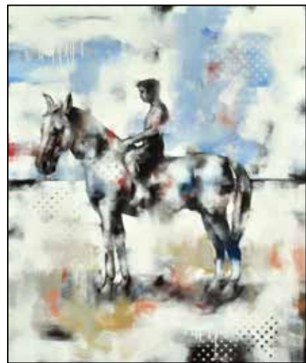
Házi kedvenc #9 – Fehér ló, fehér mezőn