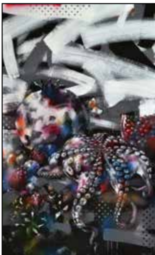
A bőség zavara