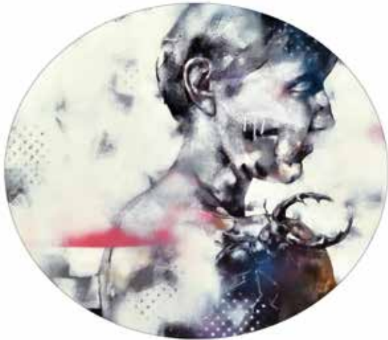
Házi kedvenc #2