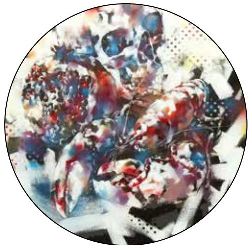
Az idén bőséges termés volt