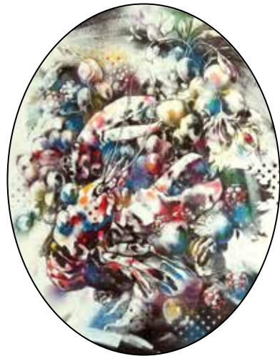
Csoda szép kalcium