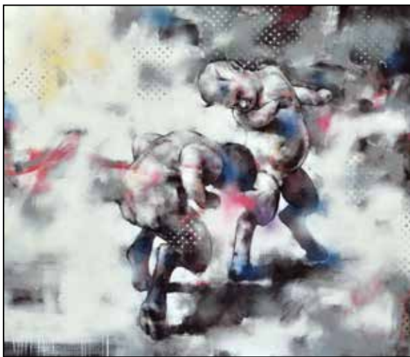
Harci játék (Benczúr Gyula után) #2