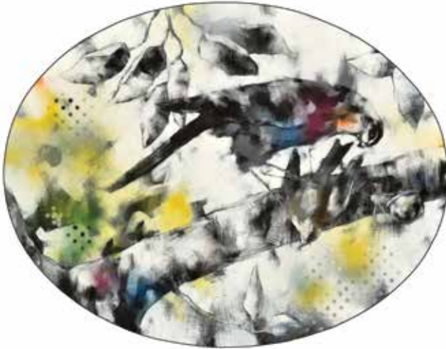
Jó nap a vadászatra, jó nap a halálra