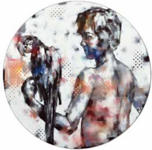
Házi kedvenc #4