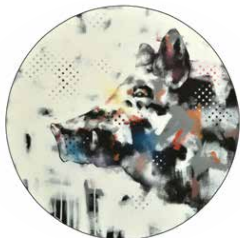
Nagypánál (A trófea)