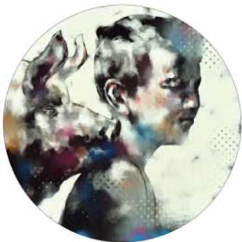
Házi kedvenc #8