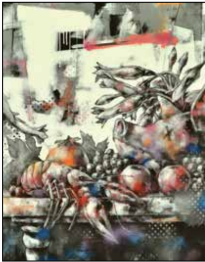
Klorofill, kalcium, kalória