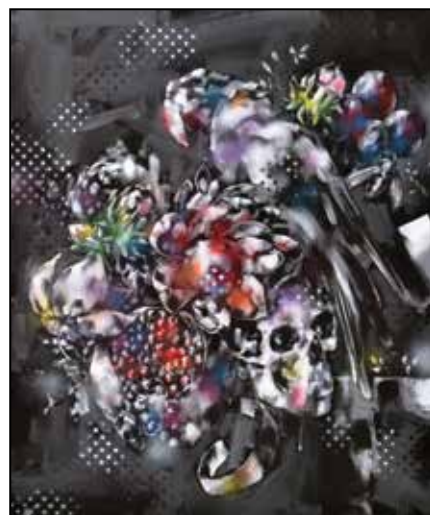
Festmény a nappali falára