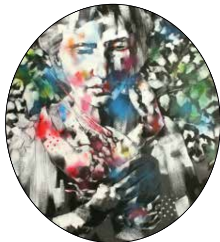
Házi kedvenc #1