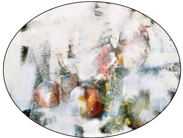
Nyári vegetáriánus csendélet