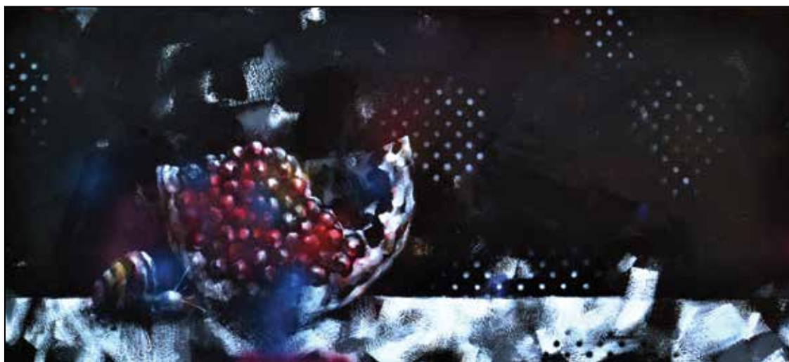
Gránátalma és csiga