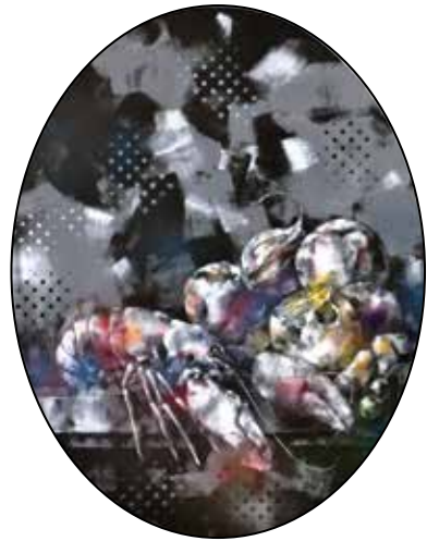
Tanulmány homárral és citrommal