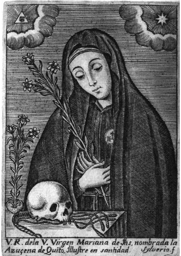
Mariana nővér, Quito lilioma