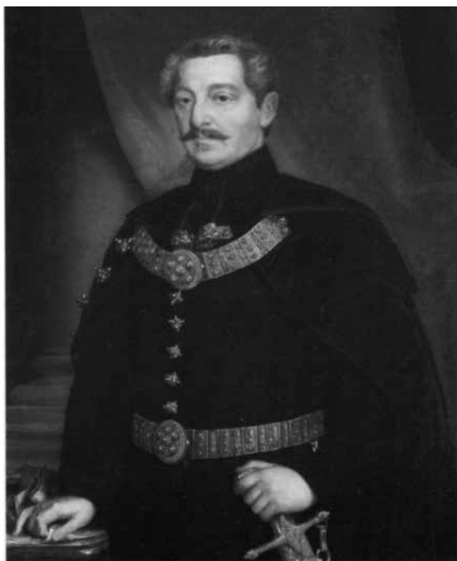
Beodrai Karátszonyi László főispán arcképe*

Beodrai Karátszonyi László háromszor foglalta el Torontál vármegye „legmagasabb” hivatalát. A korábbi – az Aracs folyóirat hasábjain megjelent – tanulmányban röviden szóltunk az első, jelen tanulmány bevezetőjében pedig említést tettünk a második hivatalviseléséről. A harmadik időszak – 1867 és 1869 között – mindössze két évet ölelt fel. A sors iróniája, hogy a harmadik főispánságát nem