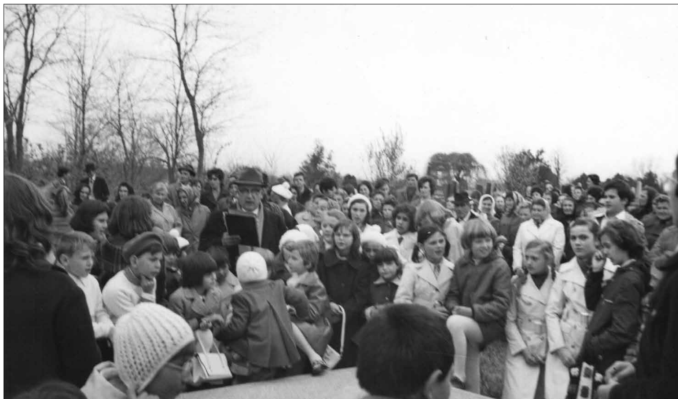
Tisztelgés a hősök, a nemes érzésű eleink emlékének. A gyermekek szavalása húsvétkor a temetőben Hodosy püspökkel

Eszembe jutott még egy szép szokás, amit Ágoston püspök vezetett be. Húsvétkor a gyerekek a temetőben, az első világháborúban elesett hősök emlékművénél szavaltak, énekeltek. Hodosy püspöksége alatt is megtartották a húsvétvasárnap délutáni szaválást a temetőben, Ágoston püspök sírjánál, rossz idő esetén volt csak a templomban. Csete püspök szolgálata