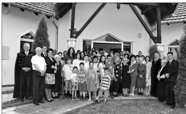
...és az avatóünnepség résztvevői

találják az utat a fiatal lelkipásztoraink a gyerekek és a fiatalok szívéhez. Az okostelefonok, az internet, a különös szerkentyűk nem pótolhatják a családban, a gyülekezetben megélt szeretetet.