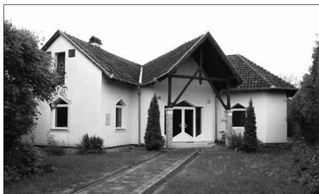
A zentai imaház...