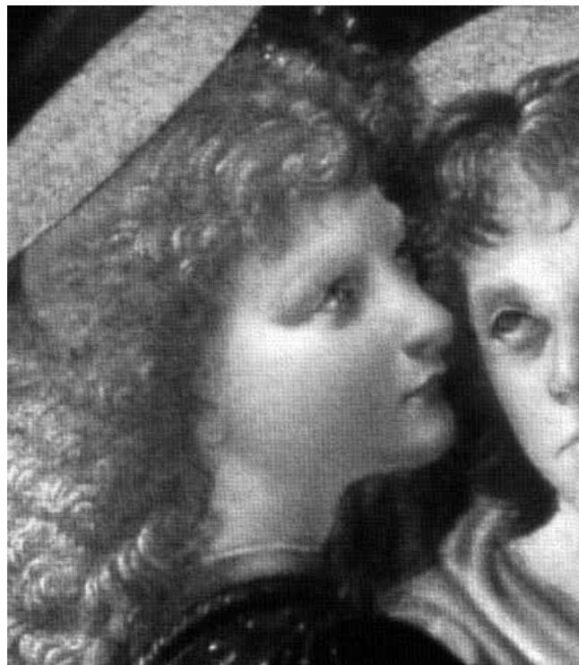
Leonardo da Vinci – térdelő angyal, részlet a Krisztus keresztelese c. képből

Vasari is megemlékezik az 1568-ban kiadott A legkiválóbb festők, szobrászok és építészek című életrajzgyűjteményében, és megjegyzi, hogy ezen kívül Lorenzo Medici sok más művet is küldött a magyarok királyának. 4 Európa nagy része, így Firenze is Mátyás királyra, mint Nagy Sándorhoz hasonló kiváló hadvezérré bízta a török hódítók feltartóztatását. Logikus feltételeznünk, hogy amikor Mátyás király a nápolyi király lányával kötendő házasságára készülve kiváló festőt keresett, hogy választottjának arcképét lefesse, akkor a firenzei követe útján Verrocchiónál érdeklődött. Verrocchio legkiemelkedőbb festője ekkor Leonardo volt, aki a mester Krisztus keresztelese képére (Firenze, Uffizi) – éppen 1470 körül – az előtérben térdelő angyalt és a háttér tájképét festette. Az angyal átszellemült költői, ugyanakkor élettelen megjelenítése annyira új és káprázatos volt, hogy Verrocchio többet nem fogott ecsetet. Áttért a szobrászatra. Leonardo tehát méltónak bizonyult a magyarok hatalmas és a művészetekben is jártas királya magas igényének kielégítésére.