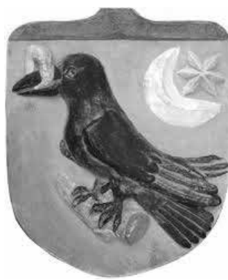
A Hunyadi család címere

címerében központi helyet elfoglaló hollóról és a királyi gyűrűről szóló történetet 1 , amely igazolja, hogy Zsigmond elismerte fiának Hunyadi Jánost.