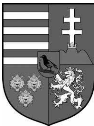
Mátyás király címere

Mátyás nevelésének az irányításával. Ezekből a tényekből is egyértelmű, hogy Hunyadi János és családja nem csak egy volt a főúri családok közül. A kortárs krónikák, majd a későbbi századok különböző elméletekkel magyarázzák Zsigmond király hadvezérének, kiemelt udvari emberének, Hunyadi Jánosnak a származását. A mai történészek egyre inkább elfogadják, amit a kortársaktól kezdve minden korban tudtak, de nem illett beszélni róla, hogy Hunyadi János Luxemburgi Zsigmond király fia volt. Antonio Bonfini, Mátyás király történetírója Mátyás életének utolsó éveiben, 1488-ban érkezett hazánkba, és kapta a királytól a megbízást Magyarország történetének méltó, humanista szellemű megírására. Ő hűségesen ismerteti a Mátyás király