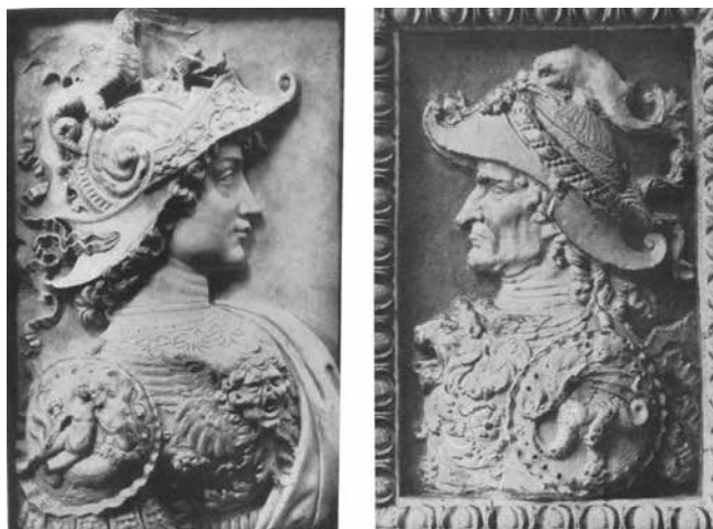
Verrocchio: Nagy Sándor – márvány dombormű, New York, Strauss-gyűjtemény – és ellenfele, Dareiosz perzsa hadvezér portréja, 16. századi majolikamásolat, Berlin, Bode Múzeum

A kérdés most az, hogyan került Leonardo kapcsolatba Mátyás királlyal. Hogyan jutott Beatrix hercegnő portréjának megfestéséhez? Az egyetlen lehetséges válasz, hogy Mátyás királytól kapta a megbízást még az 1474. évi eljegyzése előtt vagy közvetlen utána, de mindenképpen az 1476. decemberi esküvő előtt. Erre utal Leonardo szövegében a király kedvese megjelölés. De hogyan kerülhetett erre sor? Honnan ismerhette Mátyás Leonardót 1473 és 1476 között? Hol volt ezekben az években a 21-24 éves Leonardo? A válasz: Firenzében, a város leghíresebb művésznak, Andrea del Verrocchionak (1435–1488) a műhelyében, amely a várost vezető Lorenzo Medici bankár pártfogását élvezte. Verrocchio alkotásaiból már több jeles művet, főképpen a történelem legjelesebb hadvezéreinek, Nagy