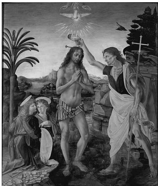
Verrocchio: Krisztus keresztelese – táblakép, Firenze, Uffizi