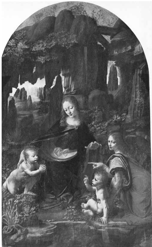
Leonardo da Vinci: Sziklás Madonna, Párizs, Louvre, 1485

más, mint a Párizsban, a Louvre-ban lévő híres Sziklás Madonna . 6 Jóllehet, eredetileg 1483-ban a milánói Szeplőtelen Fogantatás Testvériség