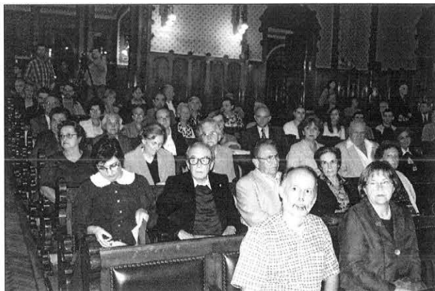
A Városháza dísztermének közönsége