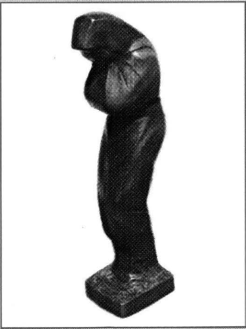
E számunk képzőművészeti anyagát Almási Gábor szobrászművész alkotásai képezik