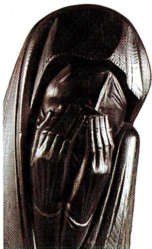
OROSHÁZI EMLÉKPARK, FEKETE MADONNA