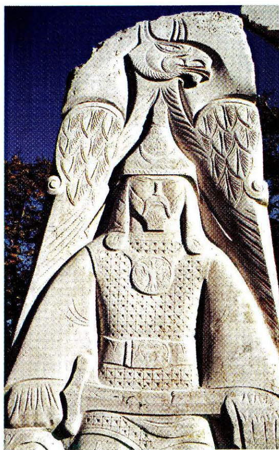
MAGYAR OLTÁR (RÉSZLET)