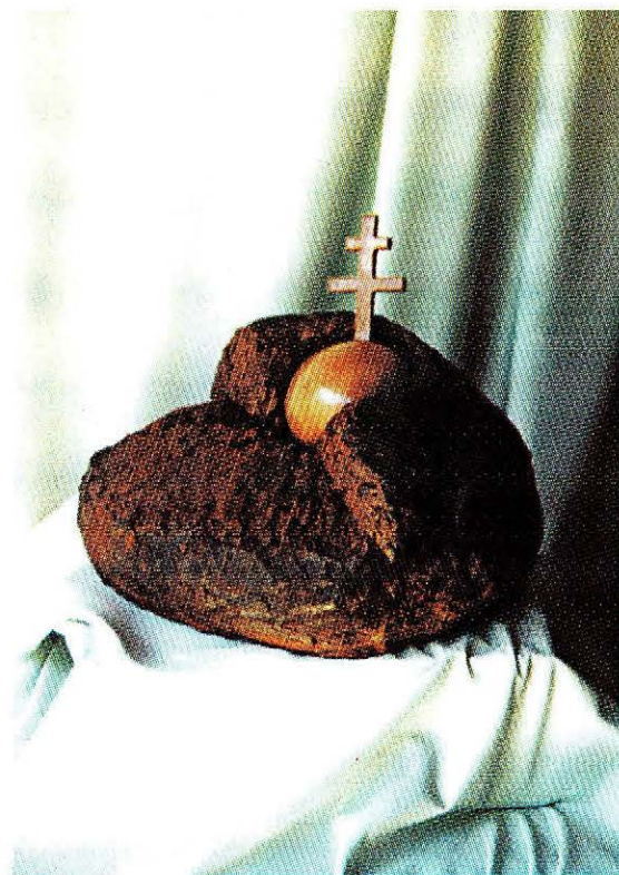
Török István: Jelképek Boros György: Szimbólumok vonzásában Csobanov Márta: Születés

E számunk képzőművészeti anyagát a Szabadkai Grafoprodukt Nyomda szervezésében megtartott 2002. évi jahdújárás festőtábor alkotásaiból válogattuk. A grafikák Gyurkovics Hunor munkái.