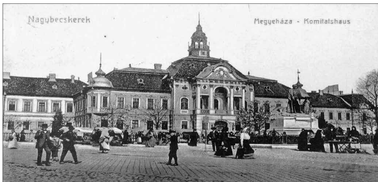
Torontál vármegye székháza Nagybecskereken