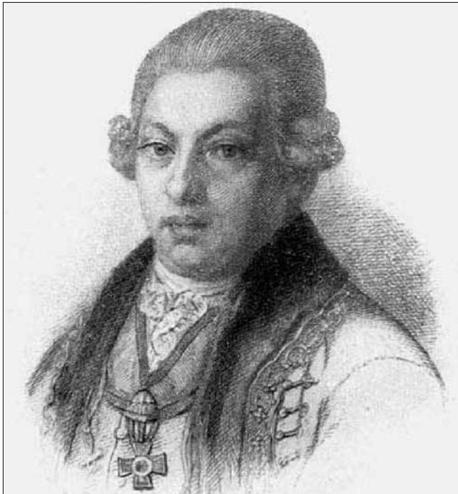
Gróf Niczky Kristóf portréja

hogy a magyar nemzet egyik nagy sérelmét „orvosolta”, azaz a Bánság inkorporálását véghezvitte. Ezt a kivételes életpályát azonban jelentősen beárnyékolta az akkoriban – Magyarországon is – népszerűtlen II. József iránti feltétlen hűsége és az uralkodó támogatása.