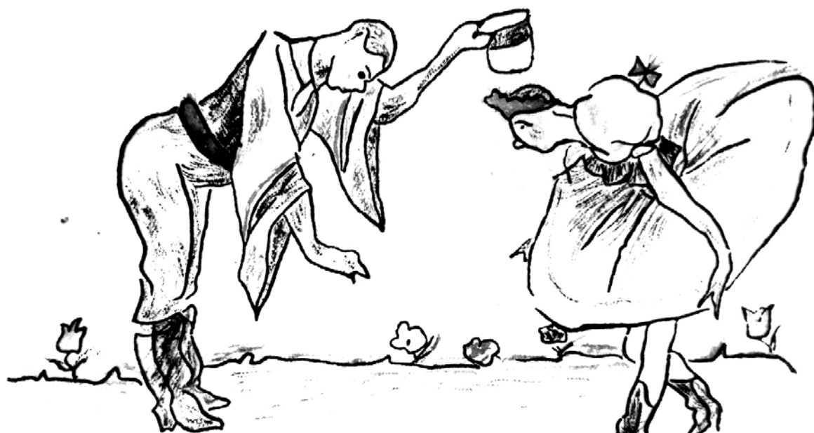
A „Bolyai Farkas” bálja Beograd 1941