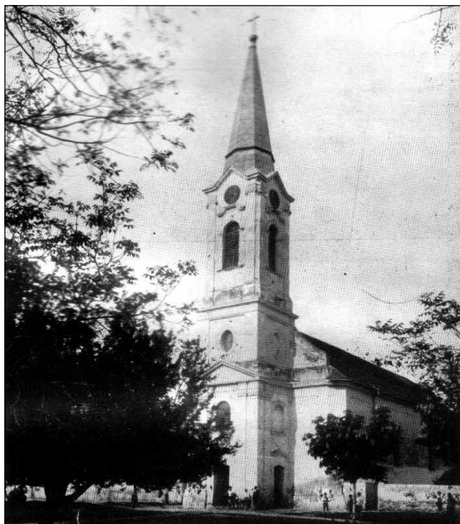
2. kép: Szenthubert egykori római katolikus temploma