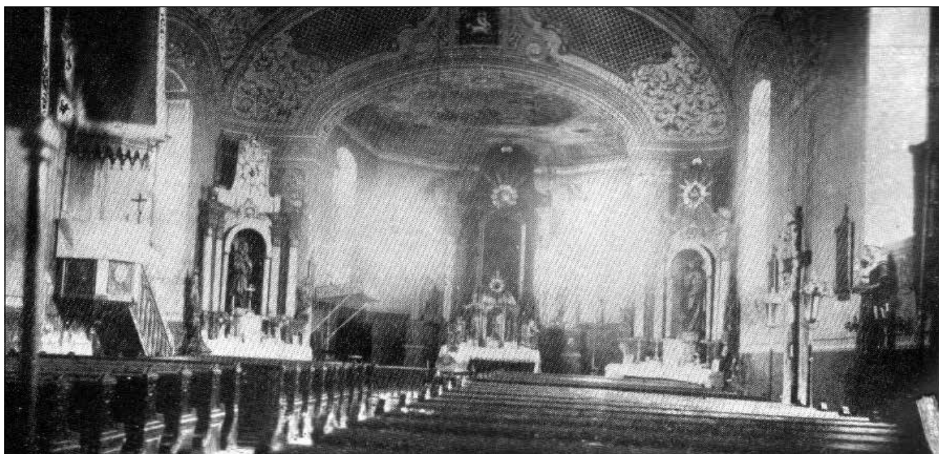
3. kép: Szenthubert római katolikus templomának fő-, illetve mellékoltárai

Banattera, Die Enzyklopädie des Banats, Neubeschenowa : http://www.banattera.eu/german/content/neubeschenowa