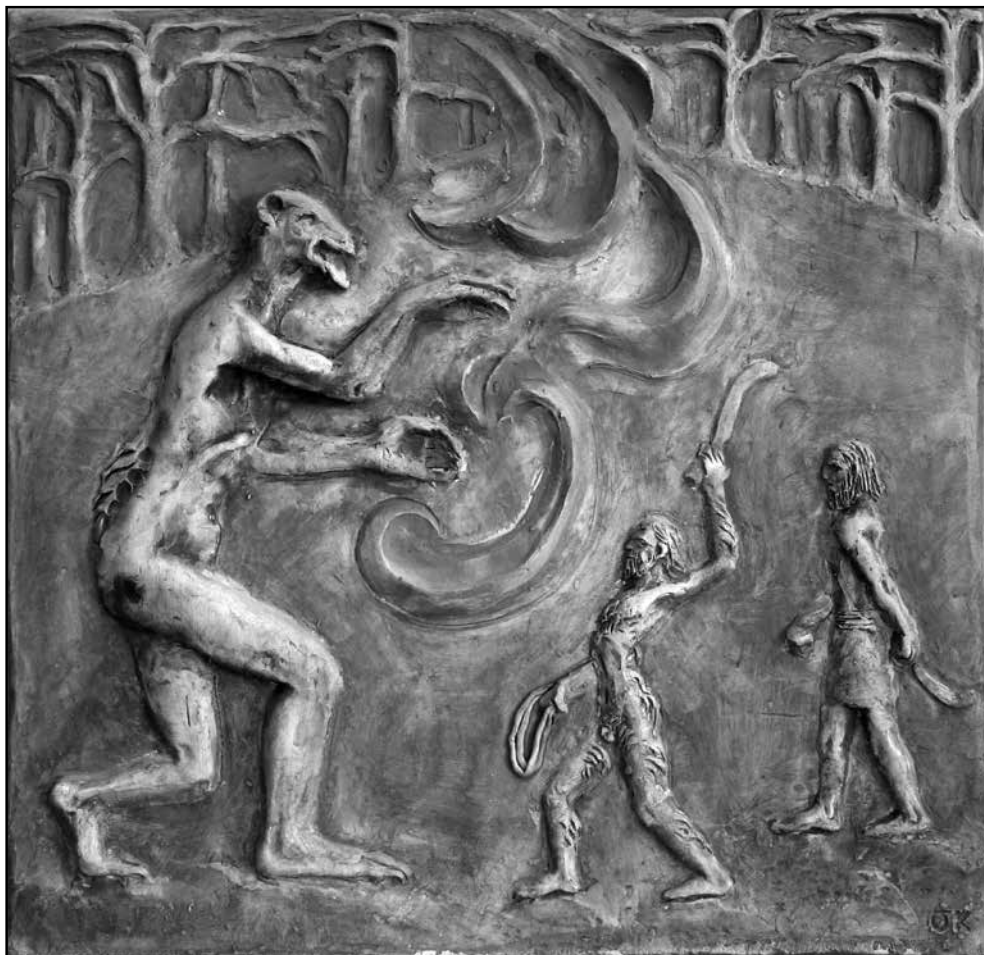
Sugallatok I. – Gilgames

ZOMBORI ISTVÁN: A Szeged-Csanádi Püspökség Egyházmegyei Múzeum és Kincstár. A Szeged-Csanádi Püspökség története . Szeged, 2007: http://www.sulinet.hu/oroksegtar/data/egyhaztortenet/A_szegedi_csanadi_puspokseg/pages/001_szeged_csanadi_puspokseg.htm