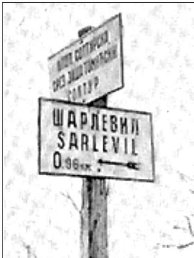
1. kép: Útjelző tábla Charleville és Seultour között az 1930-as években