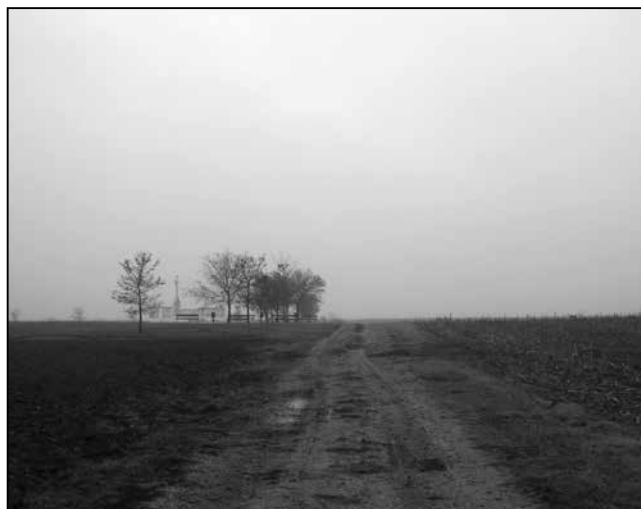
2. kép: A Rezsőháza határában található német tömegsírhoz és emlékműhöz vezető út

gedésekkel nem tudtak érdemben megküzdeni. Télen a hideg, a fagy okozott jelentős problémát, mivel a lakók a falu üres házaiban laktak, ahonnan az értéktárgyakat, bútorokat a jugoszláv partizánok már az első körben elszállították. Az emberek – nem ritkán egy-egy házban 15-20 fő – szalmán feküdtek, és száraz fűvel kevert marhaganéval fűtöttek. Volt, aki a tető tartógerendáit használta fel tüzelésre. A táborlakókat ért brutális bánásmázásokról egy szemléletes példát érdemes megemlíteni: „1946: egy forró nyári napon kihajtották az egész tábor egy, a tábortól keletre fekvő legelőre. A foglyoknak a tűző napon kellett egész nap állni mozdulatlanul; a gyermekek sem kaptak egy csepp vizet és senki sem mehetett félre. Az örök lelövélssel fenyegették azt, aki helyét megpróbálta elhagyni.” 25 Fennállása alatt közel 33 ezer, jórészt német személyt tartottak fogva Rezsőháza embertelen körülmények között, elsősorban öregeket, betegeket, gyermekeket, valamint nőket és csecsemőket. 26 A becslések szerint mintegy 11 ezer német halt meg Rezsőháza tábor fennállása alatt. Ebből – név szerint – 7745 fő személye dokumentált. 27 A haláltábor felszámolása – 1948 márciusa – után az üresen álló falu házaiba Bosznia-Hercegovina, Horvátország, illetve Montenegró területéről szerbek érkeztek. Ettől kezdve Rezsőháza szerbek lakta településsé vált. A németekre már csak a falutól délre található tömegsír utal, ahol előbb, 1998-ban egy emléktáblát, később, 2003-ban pedig egy méltó emlékművet alakítottak ki.