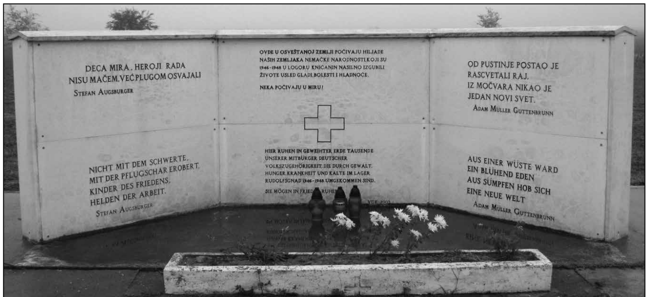
3. kép: A 2003-ban emelt szerb és német nyelvű emlékmű

nép közötti viszony«. Az egyik fiatalember úgy fogalmazott, hogy »van ugyan gyűlölködés az emberek között, de nem igaz, hogy nem szeretik a németeket«. Az egyik helybéli dicsérte a film készítőinek a bátorságát, ahogy a témához nyúltak, mert mint mondta, »most sem hiányzik sok ahhoz, hogy valaki olyat cselekedjen, mint akkor – aztán egy másik rendező készítheti a maga filmjét«. Egy másik hozzászóló a film befejezésével volt elégedetlen, amire az egyik falubelije azt válaszolta neki, hogy »ez a mi befejezésünk, olyan, amelyet a viselkedésünkkel megírunk.« 28