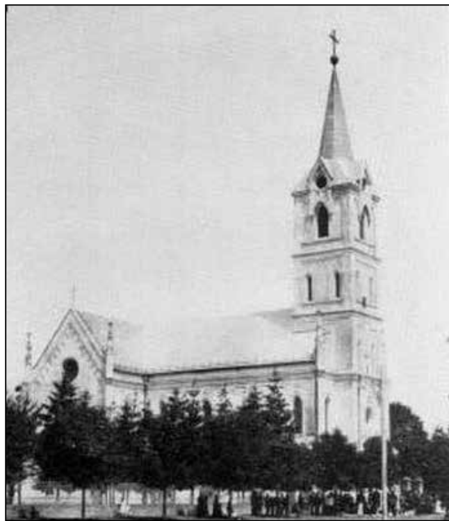
1. kép: Rezsőháza egykori római katolikus temploma

védelmi munkálatok, ennek ellenére 1867. április 29-én az árvíz mégis elöntötte a falut. Az ár elvonulása után ismét megindult a védőgátak, töltések emelése, ezért az 1868. évi árvíznek már ellen tudott állni a falu. A későbbiek folyamán a Tisza áradásai sokszor megkeserítették a német lakók életét. Az 1876. évi árvíz alkalmával Rezsőházát teljesen elmosta az ár, csak néhány magasabban épült lakóház menekült meg. Az áradás idejére a helyiek a közeli Perlasz, illetve a szemközti Titel településekre menekültek. Az árvíz elvonulása után a némettség szorgalmának köszönhetően a település újra felvirágzott, 1895-ben, valamint 1907-ben azonban ismét árvíz mosta el a település határát. Az árvízvédelmi feladatok ellátásának köszönhetően a falu – például 1882-ben és 1888-ban – egyre jobban tudott a Tisza áradásai ellen védekezni.