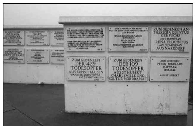
4. és 5. kép: Részletek az elhunyt áldozatok származását is jelölő emléktáblákból