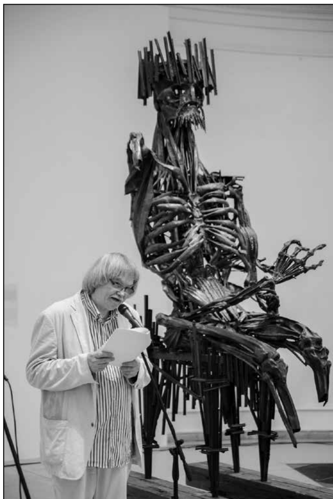
Magyar Művészeti Akadémia / Nyirkos Zsófia