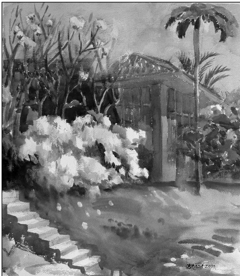
A fehér diadala