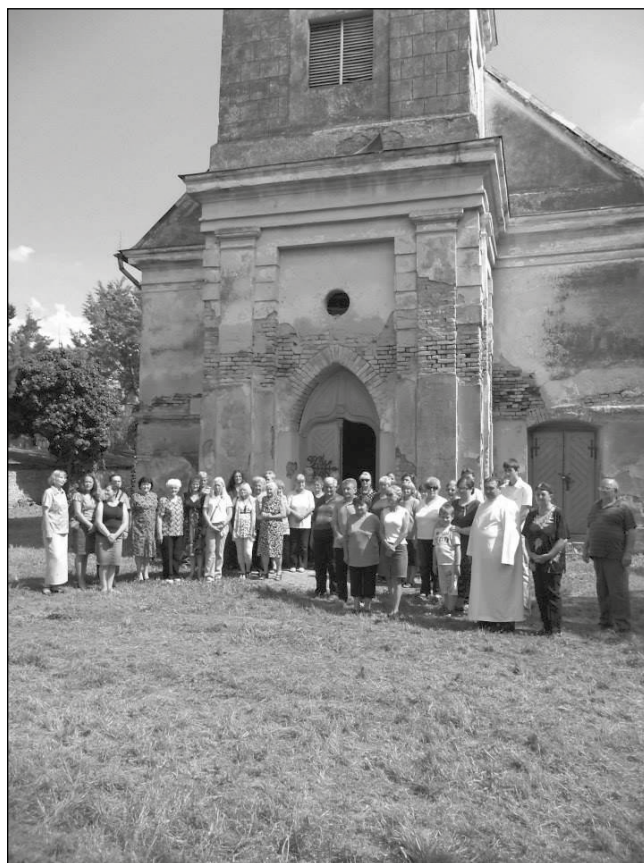
Koreni Zavičaja / Szülőföldünk Gyökerei egyesület

A Magyar Patrióták Közössége értesülései szerint a templomrombolások előkészítése már évek óta napirenden van az egyházmegyében. Ezzel függhet össze az is, hogy a püspök korábban a németcsernyei templom több értékes berendezési tárgyát, így a feszületet, a templom védőszentjének szobrát és értékes festményeit is elvitette. De nemcsak Németcsernyéért kell aggódnunk. Olyan híresztelések is eljutottak hozzánk, hogy akár két számjegyű is lehet azoknak a régi templomoknak a száma, amelyeket az egyházvezetés le kíván bontani.