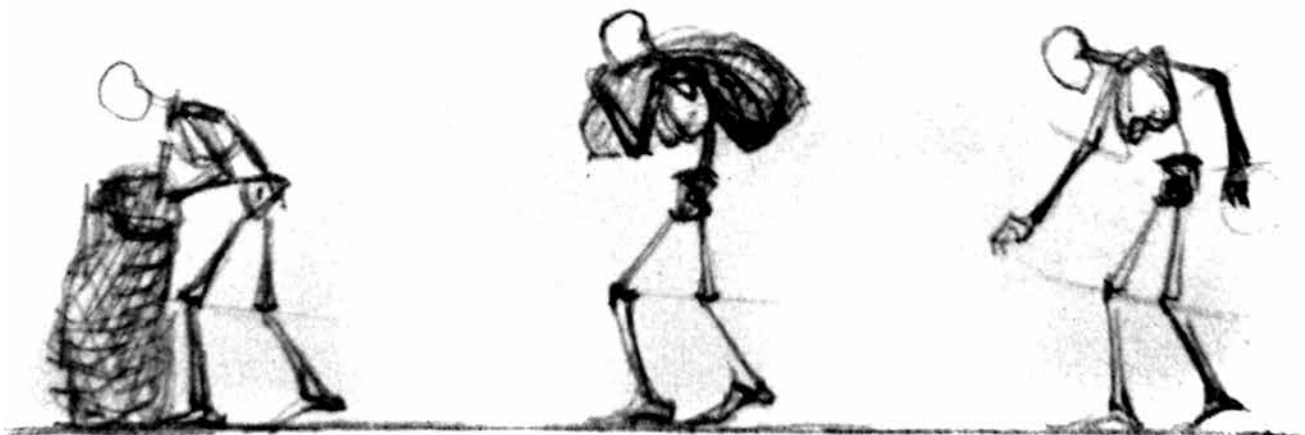
Részlet a Művészeti anatómiából