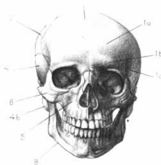
Részlet a Művészeti anatómiából