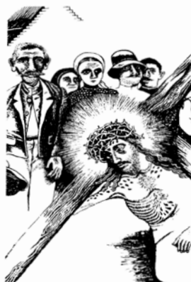
KRISZTUS URUNKAT MÖGFOGTÁK, MÖGKÖTÖZTÉK, FÖLFESZÍTÖTTÉK. HARMADNAPRA FÖLTÁMADOTT