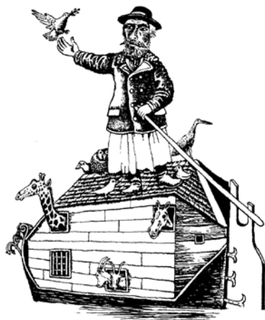
ELVESZTEM AZ EMBERT