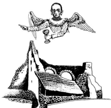
BIZONY MONDOM NEKTEK