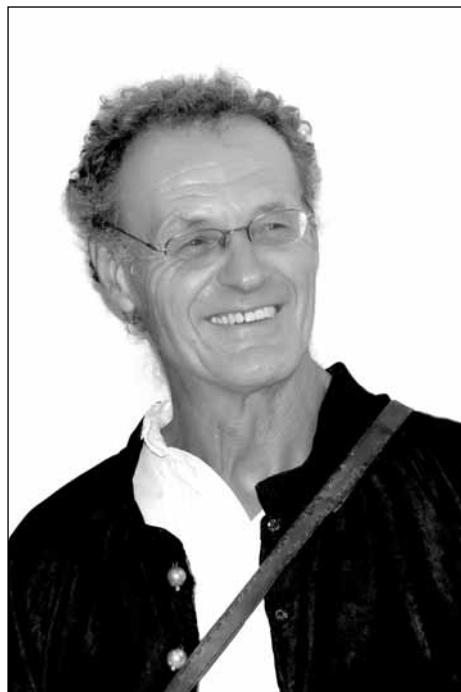
Somogyi Győző portréja