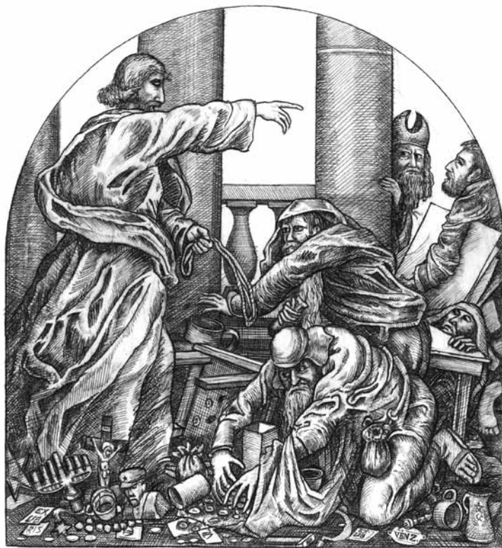
KUNDERMAN JENŐ • JÉZUS ÉS A KUFÁROK • EX LIBRIS