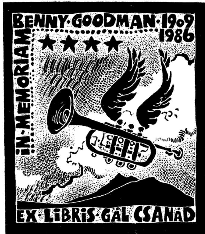
Árkossy István: Benny Goodman