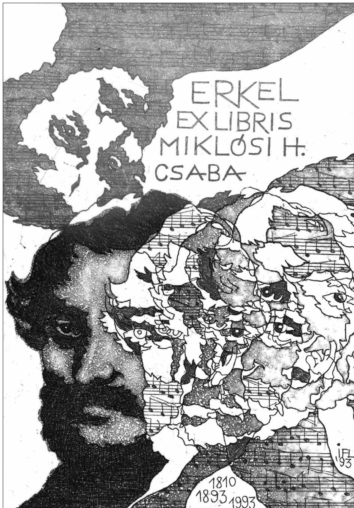
Feszt László: Erkel Ferenc