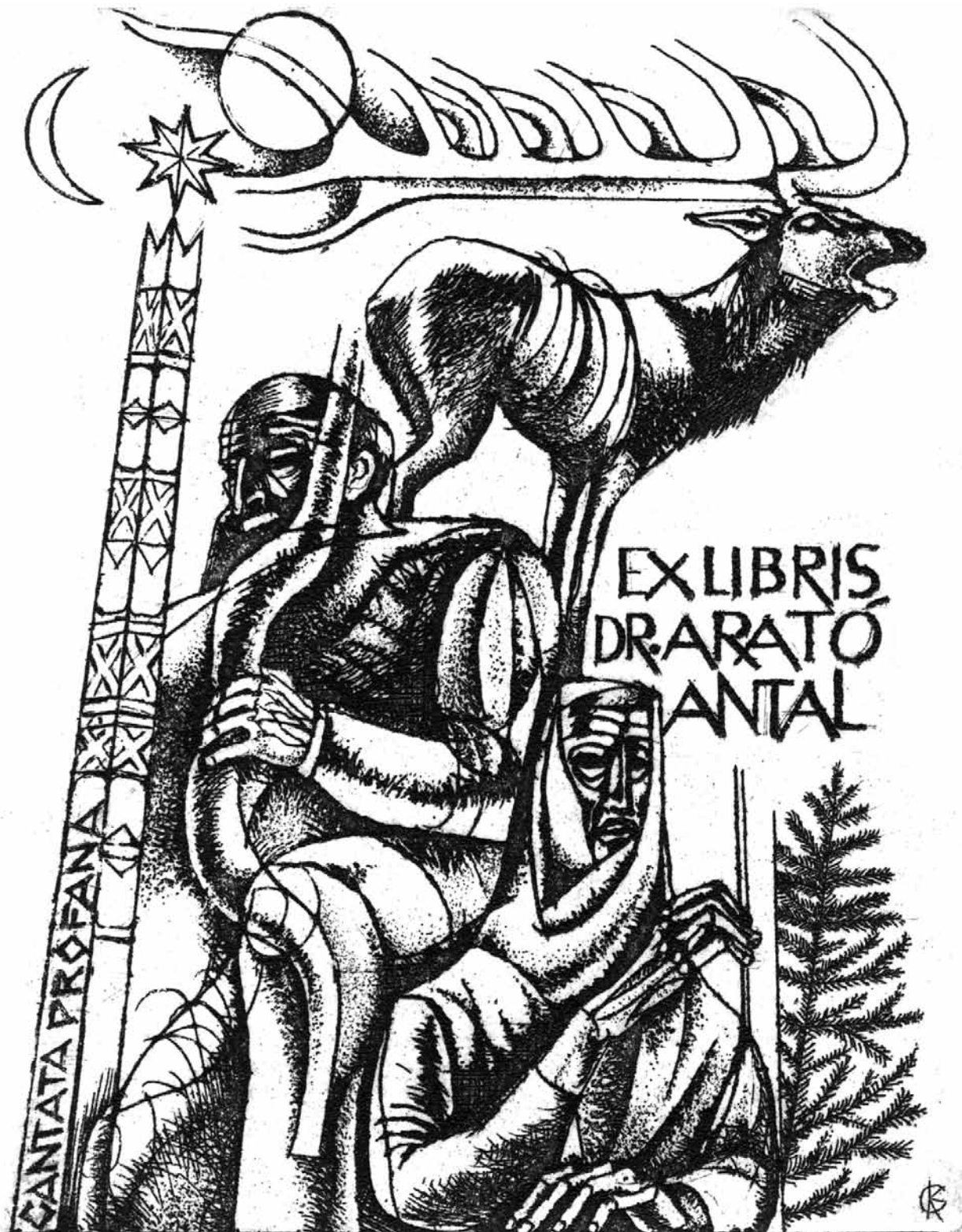
Kazinczy Gábor: Cantata profána