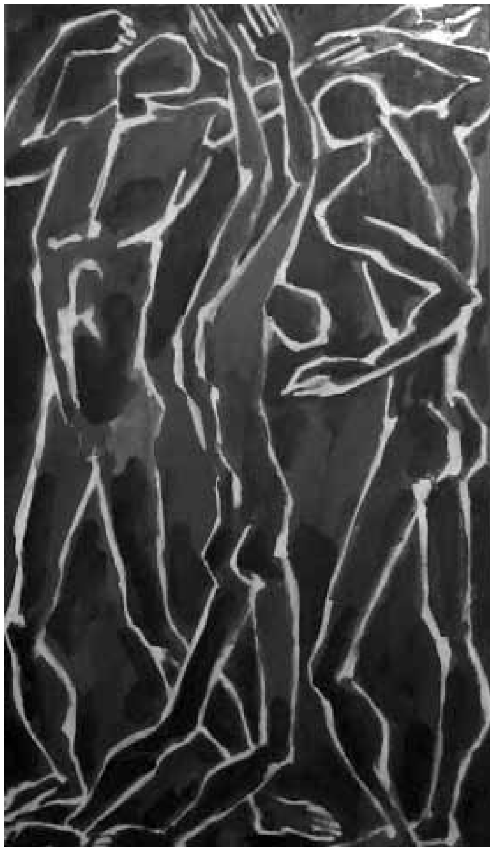
Keresztúton, Róma, Szent István Ház