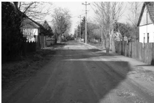
Kishomok, Alsó sor