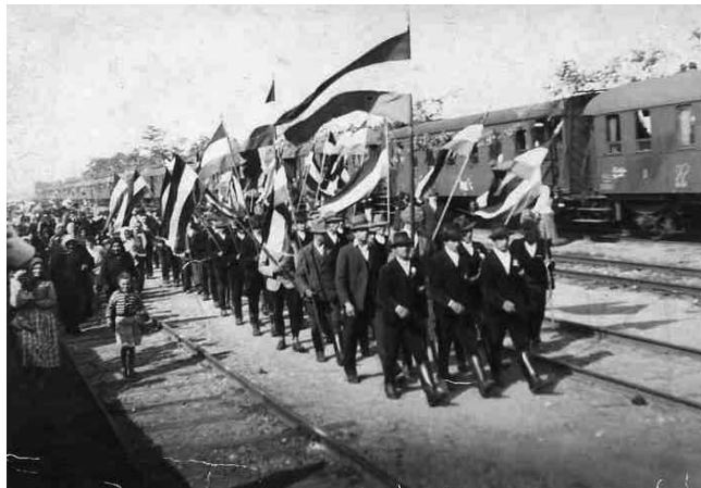
A bajmoki vasútállomásra való érkezés

Magyarország és Románia 1941. május 11-én írta alá a bukovinai székelyek áttelepítéséről szóló megállapodást. Néhány vegyes házasságban élő személy kivételével, az öt falu valamennyi lakója hazatért Magyarországra. Összesen 13 198 fő bukovinai székelyt és 1000 moldvai csángó magyart telepítettek le néhány hét alatt Bácskában, a Szabadkától Újvidékig terjedő területre. Az öt bukovinai magyar falu népe és az 1000 főnyi moldvai csángó telepes 31 településen szóródott szét.