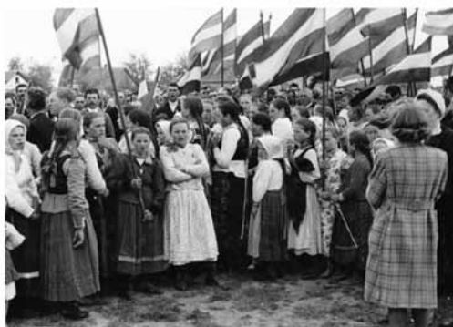
Az új bácsjózseffalvi vasútállomás és a zenélő kút avatóünnepsége, 1943. június 24.