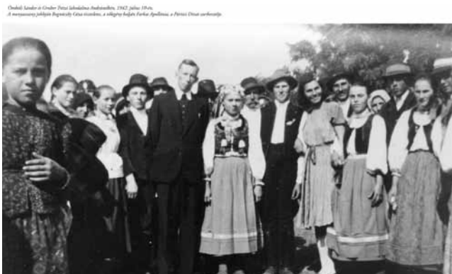
Lakodalmos Andrásstelkén 1942. július