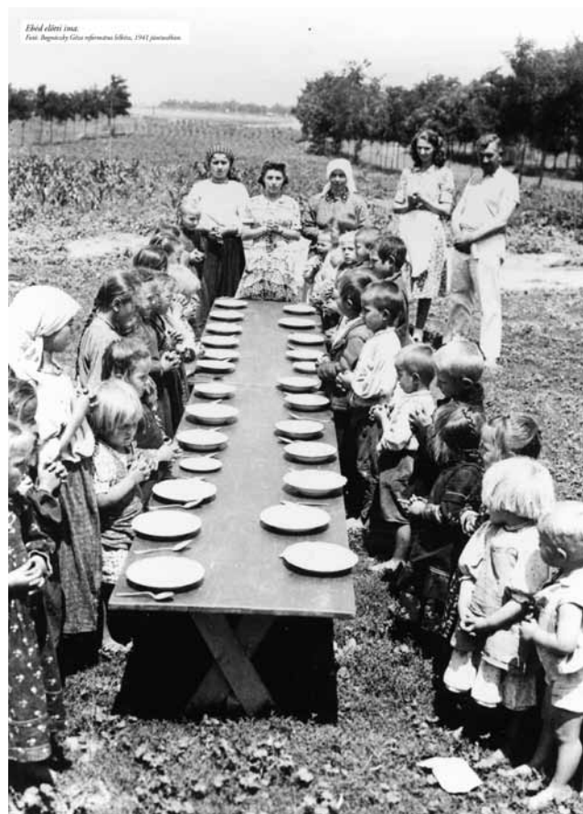
Az andrásstelki óvodások ebéd előtti imája