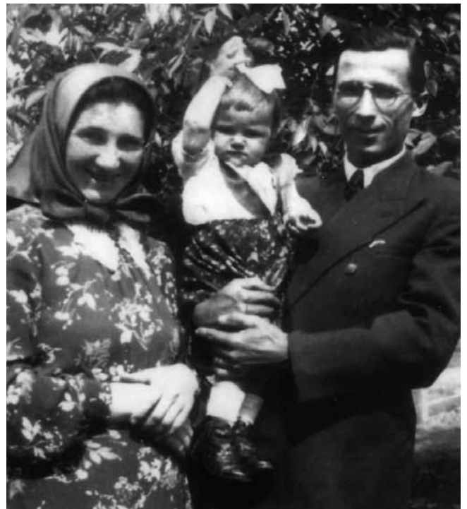
1944 nyarán szüleimmel (Ráta/ Hadikújfalu)

1945 márciusában a Dunántúlon, Tolnában, Baranya és Bács-Kiskun megye falvaiban telepítették le a bukovinai székelyeket. Az én családomat, rokonságomat a kis völgyeségi zsákfaluba, Felsőnánára vetette a sors.