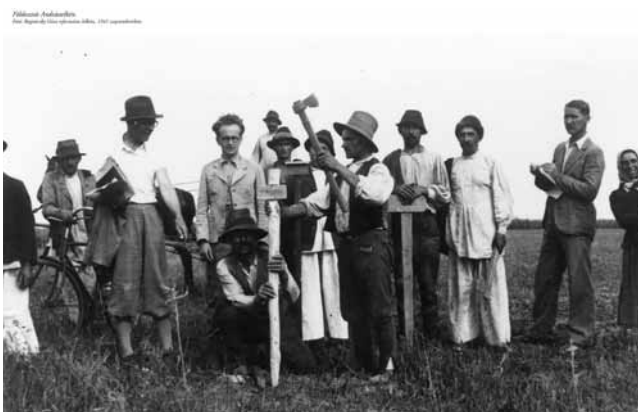
Földosztás Andrásstelkén, 1941 szeptembere

1944 októberében, mindenüket hátrahagyva, földönfutókként kellett menekülniük a visszatérő szerbek elől. A menekülés rettenetes volt. Elől menekült a német és a magyar katonaság, nyomukban a civilek ezrei, köztük a bukovinai székelyek. A Dunántúlra irányították őket. Duna-földvárnál összetorlódott a tömeg. Hat hétig a szabad ég