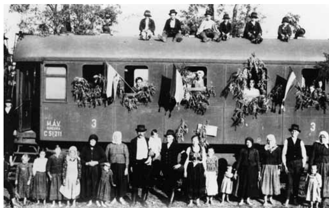
Dés, 1941. június