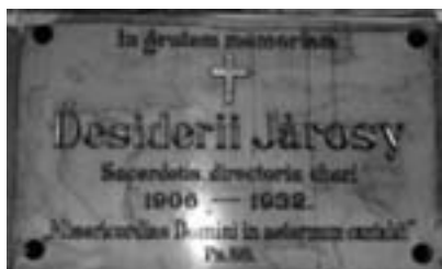
Járosy-tábla a temesvári Dóm karzatán.

ti és mozgalmi vonalon kisebb-nagyobb feladatokat. Azt természetes mozzanatnak tekinthetjük, hogy az Egyházmegyei Egyházzenei Bizottsága elnökéül választotta azt, aki országos tisztségei mellett tanárként is az egyházi zene ügyének szolgálója. 1929-ben az Erdélyi Katolikus Akadémia tagjává választják. Azt is temesvári elismertsége eredményének tekinthetjük, hogy a Zenekedvelők Egyesülete a korábbi karvezetőt előbb alelnökké, majd a szervezet fennállásának 60. évfordulóján, 1931-ben tiszteletbeli karnagyává választotta. Védnöke a Temesvári Dalkörnek, dísztagja