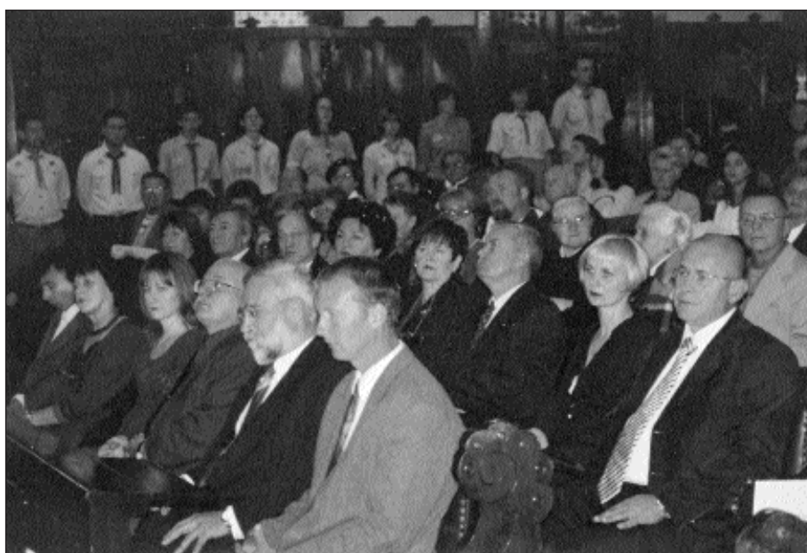
Az első sorban a díjazottak

A sors törődése és intése édes és súlyos teher mindannyiunk számára. Díjazottjaink viseljék ezt a súlyt mosolyogva. Segítse őket ebben – az elismerésen túl – szeretetünk is. Számunkra pedig legyen példa alázatuk, amely ott lobog, harangoz tetteikben, miközben levezekelhettek egy egész nemzet számos mulasztását épp annak hála, hogy tenyerével megsimította arcukat az isteni gondviselés.