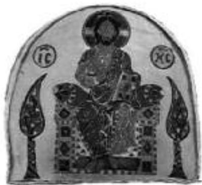
Éltető eszme: a Világbíró Isten

Adott esetben hasonlóan kell nekünk is eljárunk, hiszen az illuminátusok aljas eszmerendszere, a mai szociál-liberális kormányzatokon keresztül a társadalom vírusaként ismerhető fel, amely a társadalom szervezetére tapadva annak erőforrásait a maga javára használja fel, miközben a társadalom életképességeit lecsökkenti (betegség), de a mai neoliberais alakjában meg is öli.