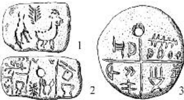
Éltető eszme: 8000 éves eredeti magyar írás a Tárlakai Táblákon.

Ha tehetjük, ne vegyünk fel hitelt, kölcsönt. Szervezzük meg az egymás segítségét munkával, értelemmel, tanítással, szükséges gondoskodással. A vírus erejét az adja, hogy a pénzt mindenki elfogadja mint abszolút értékmerőt és az életet alapvetően meghatározó eszközt, immár isteni rangba emelve. Holott a pénz nem más, mint a munkamegosztás révén szükséges csere közvetítője. Nem lehet életcél. Nem lehet az erő kifejezője. Azzá csakis úgy válhat, ha a társadalom annak elismeri. A társadalom számára azonban az értéket az ember maga jelenti a közösséghez való viszonyával, tetteivel, munkájával, gondolataival, érzésével és szellemével. Azzal, hogy mennyit és mit tesz a közös 'kalapba', ahonnan aztán „mindenki egyaránt vehet”. Egyaránt, de nem egyformán! Társadalomellenes az, hogy valaki azért markolja ki a kosár tartalmát, mert pénzt gyűjtött, mert nem voltak erkölcsi gátlásai, és a mások által megtermelt javakat ügyeskedéssel, rafinériával a saját zsebébe töltött pénzzé tudta alakítani. Az ún. 'pénzcsinálás' ma az értelmiséget vonzó terület, ezért az értékteremtés – ami valójában a társadalom életszükségeit fedezi – elszegényedik értelemben, alkotó elmékben. Ez a társadalom szá-