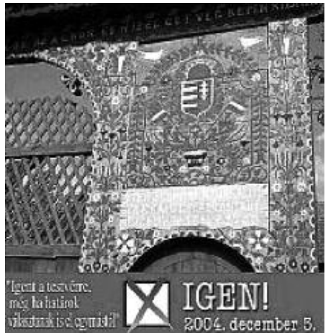
Éltető eszme: „Igen a testvére, még ha határok választanak is el egymástól”