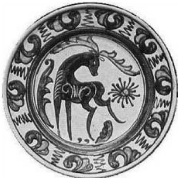
Éltető eszme: a Csodaszarvas

Ez a globalizáció lényege és célja. Ez a neoliberális társadalmi rend lényegi ereje. Ez az, amit nem sza-