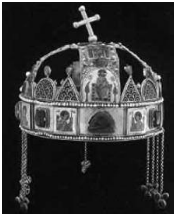
Éltető eszme: a Szent Korona