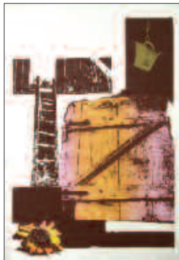
Jobbágyok hava II., III.