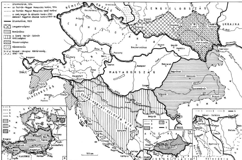
1. térkép. Az Osztrák-Magyar Monarchia felosztása, 1918-1920