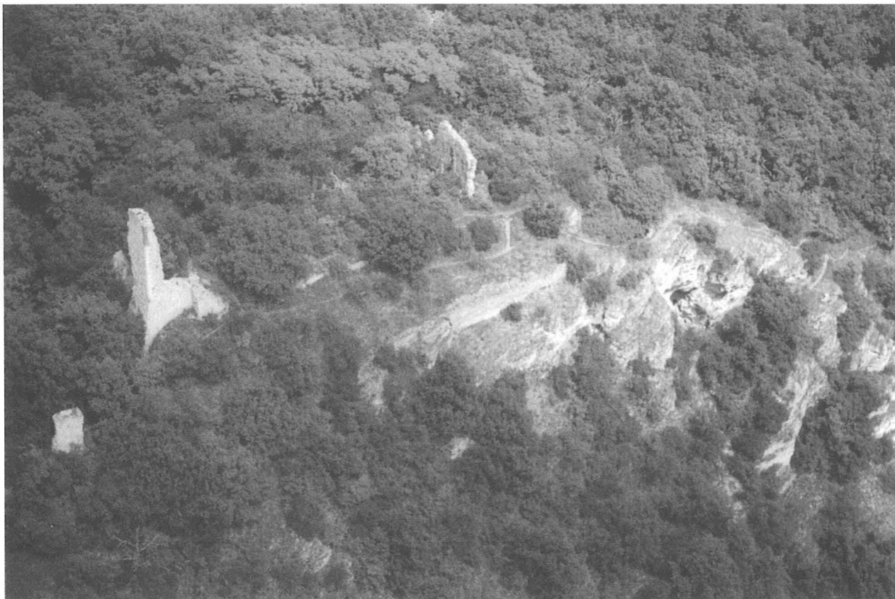
3. kép, Fig. 3: Csóvár, Vár (2006. május 25.; May 25, 2006)