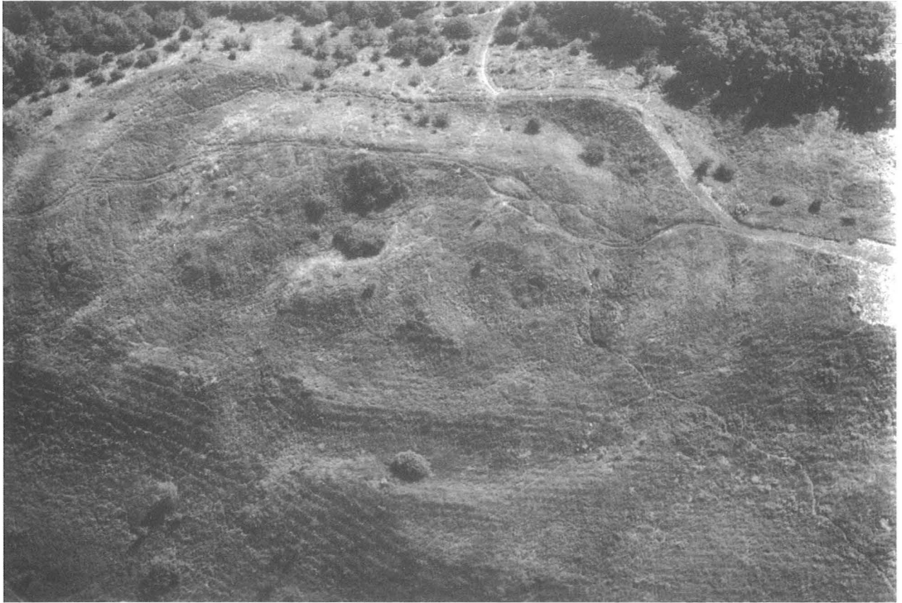
5. kép, Fig. 5: Galgahévíz, Szentendrőspart (2006. július 5.; July 5, 2006)