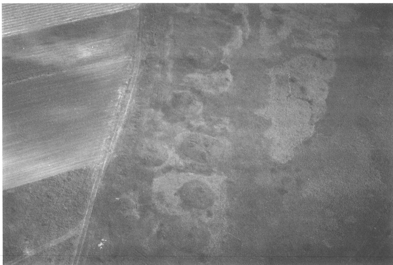
8. kép. Fig. 8: Tápiószele, Tatárhányás (2006. május 15.; May 15, 2006)