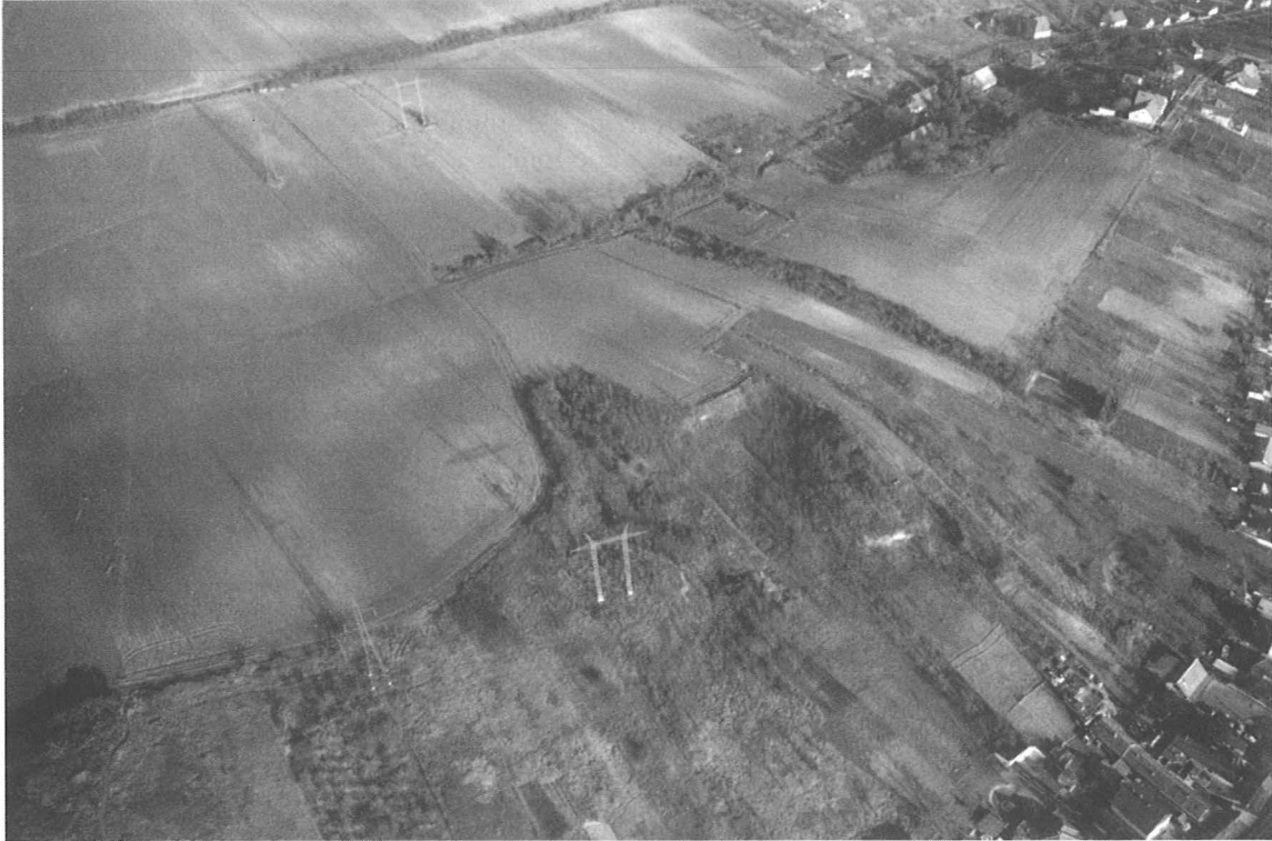
1. kép, Fig. 1: Aszód, Manyik (2006. december 20.; December 20, 2006)