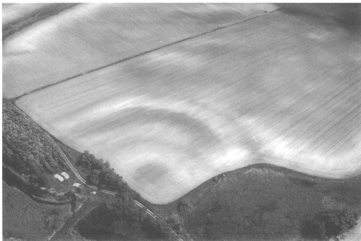
4. kép, Fig. 4: Dömsöd, Leányvár (2006. május 15.; May 15, 2006)