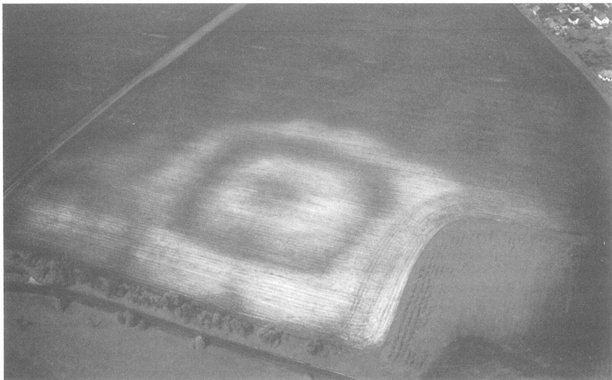
9. kép, Fig. 9: Zsámbok, Kerek-halom (2006. május 25.; May 25, 2006)