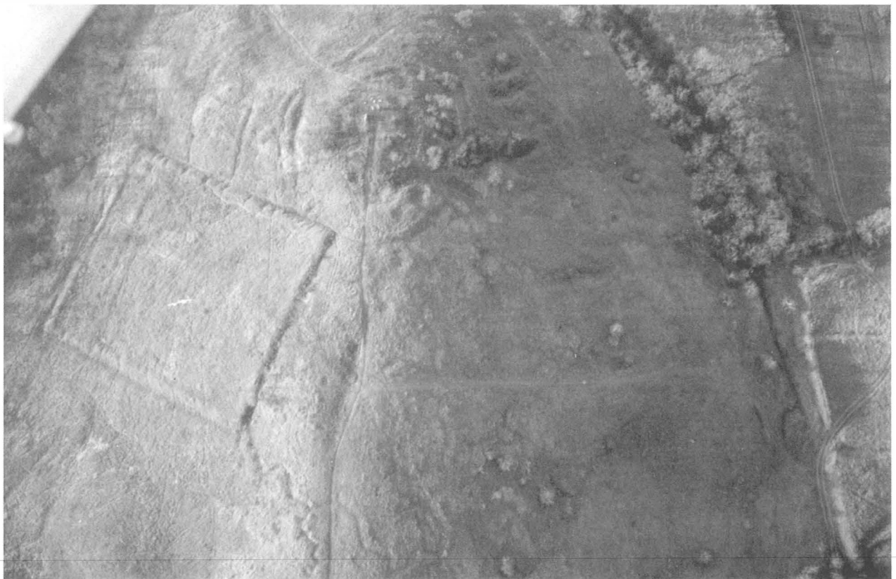
6. kép, Fig. 6: Kerepes, Kálvária (2006. december 20.; December 20, 2006)