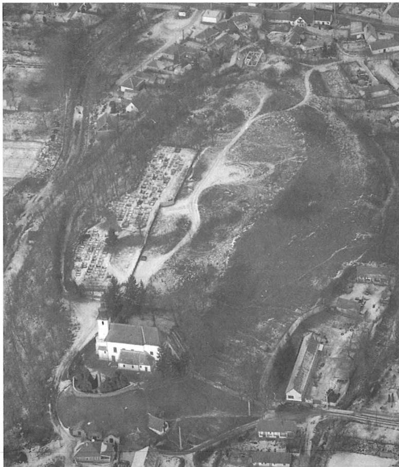
2. kép, Fig. 2: Bernecebaráti, Templom-hegy (2006. február 9.; February 9, 2006)