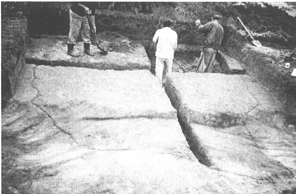
3. kép: Késő kelta ház bontása Fig. 3. Clearing of the late Celtic house