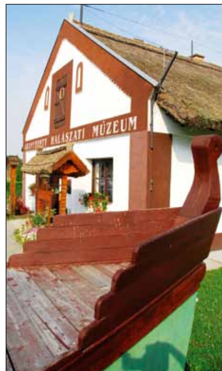
A Rétimajorban halászati múzeumot is látogathatnak a vendégek

A mi előadásunk sajnos ebéd utánra került, ami abból a szempontból nem volt túl szerencsés, hogy ilyenkor a hallgatóság figyelmé rendszerint csökken. Ennek ellenére azért sikerült komoly érdeklődésre szert tenni a bemutatónkkal, mely a többi meglehetősen száraz, sok szöveget és számot tartalmazó előadáshoz képest, igen színes és látványos volt. A jelenlévők többségének először is be kellett mutatni azt, hogy mi is az a tógazdasági haltermelés, ugyanis számukra az akvakultúra az nem más, mint elsősorban lazac-, és pisztrángtenyésztés, intenzív gazdaságokban. Ezután bemutattuk az Aranypony Zrt. rétimajori telephelyén kialakított turisztikai létesítményeket, valamint színes képekkel illusztráltuk az általunk multifunkcionális tógazdálkodásnak keresztelt modell főbb elemeit. Előadásunk végén nagy hangsúlyt fektettünk a magyar halászati ágazat számára komoly gazdasági problémákat okozó tényezőkről, mint például a vé-