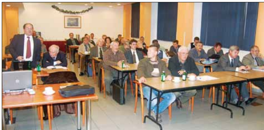
A közgyűlés résztvevői

A HOP 3-as tengelyének programalkotási folyamata a két szövetség összehangolt munkáját is eredményezte. Úgy tűnik, hogy a vélemények közös nevezőre hozatala nem oly nehéz, amit a határidőre vonat-