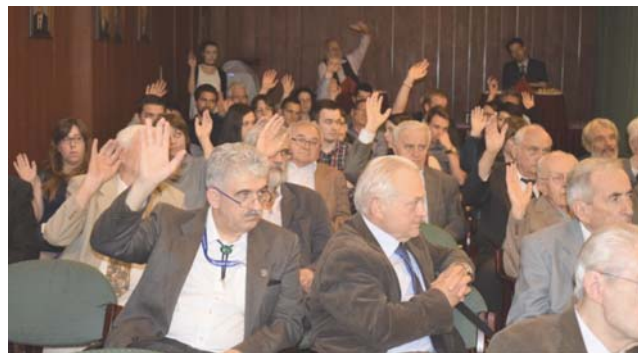
A Közgyűlés szavaz