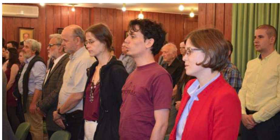
A Közgyűlés első percei: a jelenlevők és az elnökség a Himnuszt éneklék