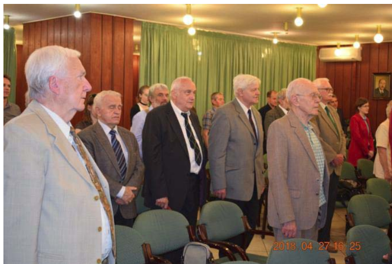
A Közgyűlés zárása: Bányászhimnusz