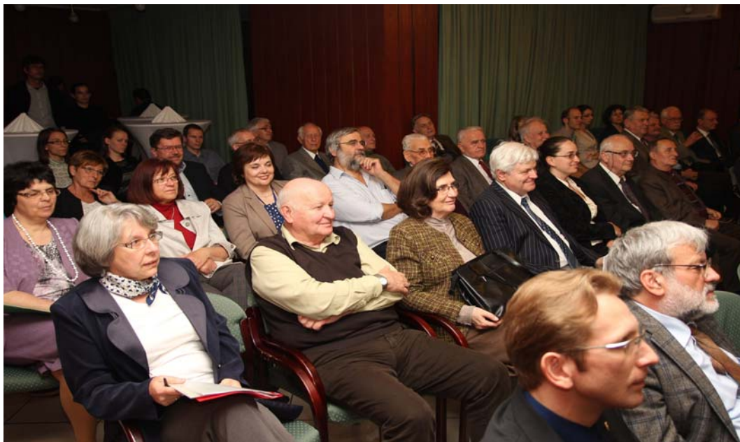
A tisztelt közgyűlés figyel

veket lezárták, a főkönyvi kivonatot egyeztették, ellenőrizték, és megállapították, hogy a beszámoló a valóságnak megfelel. A mérleg elkészítésével párhuzamosan – annak részeként – kell elkészíteni a közhasznúsági mellékletet is, amely a vonatkozó törvény szerinti mutatószámokat is tartalmazza.