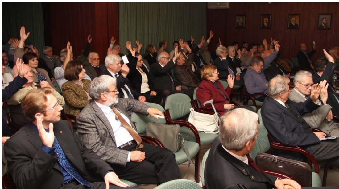
A tisztelt közgyűlés elfogadja a beszámolókat