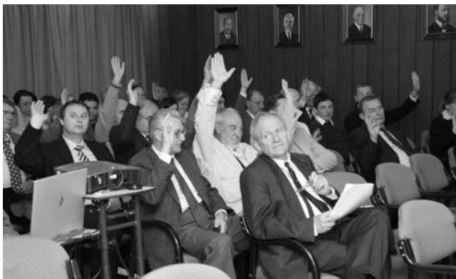
A Közgyűlés résztvevői szavaznak