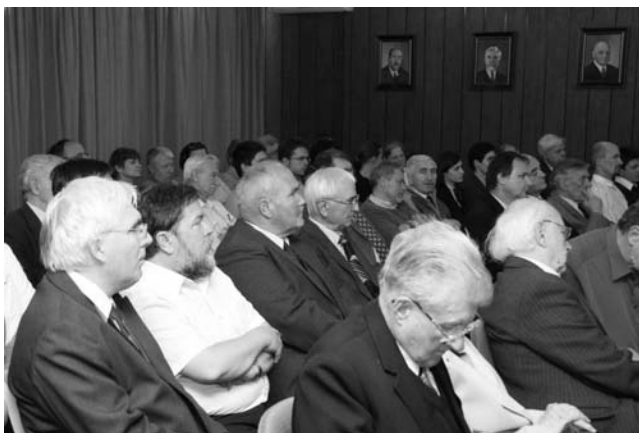
A hallgatóság egy része