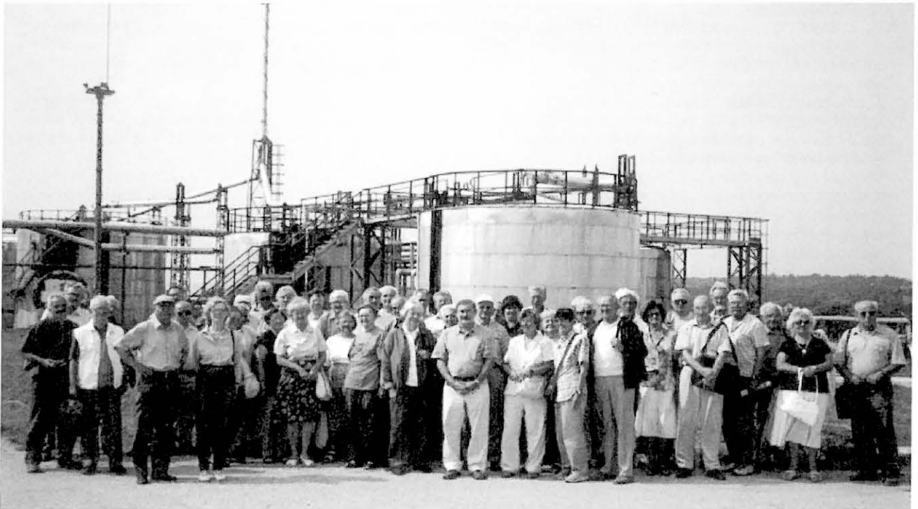
A tanulmányi kirándulás résztvevői a Nagylengyel III-as blokknál