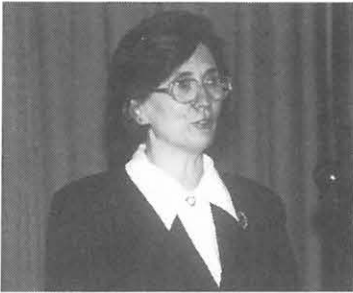
Az utolsó alelnöki feladat

A közgyűlés egyhangú határozatot hozott arra vonatkozóan, hogy a Magyar Geofizikusok Egyesülete kérje közhasznú szervezatként történő nyilvántartásba vételét.