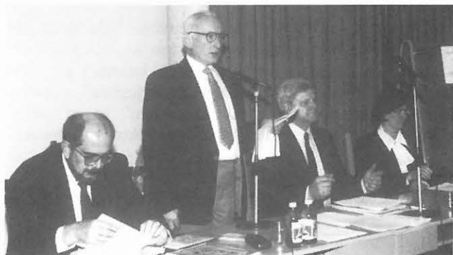
A Renner János Emlékérem egyik kitüntetettje, kuratóriumi elnökként