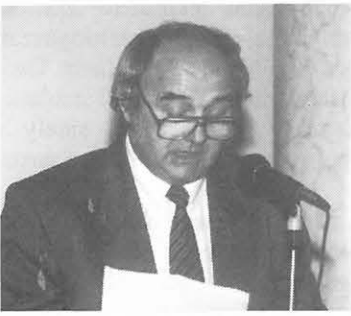
Az ellenőrzés mindent rendben talált

sajátsága, hogy a költségek eléggé előreláthatók, de a bevételek mindig bizonytalanabbak.